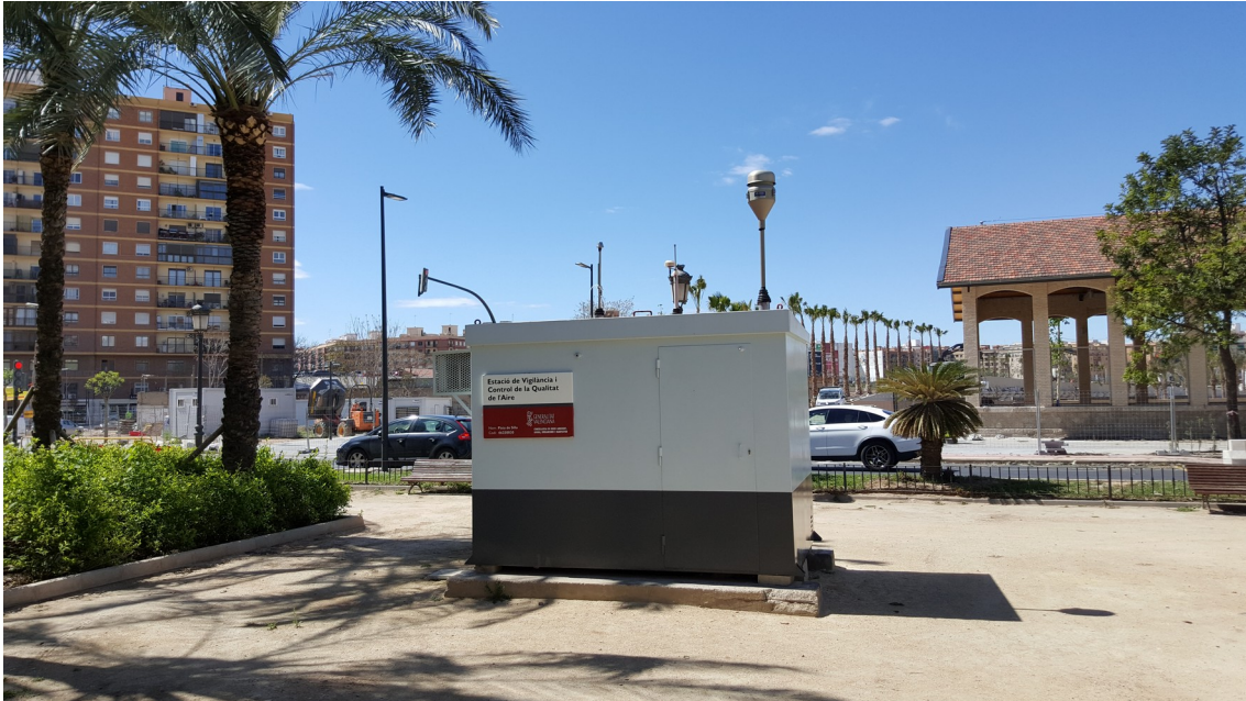
Foto: Estació a València-Pista de Silla

En algunes estacions es disposa a més de sensors per a diferents paràmetres meteorològics, com la velocitat i la direcció del vent, la humitat relativa, la radiació solar, la pressió atmosfèrica i la precipitació. Aquests paràmetres són útils per a la interpretació de les dades i el coneixement de la dinàmica dels contaminants en el si de l'atmosfera.