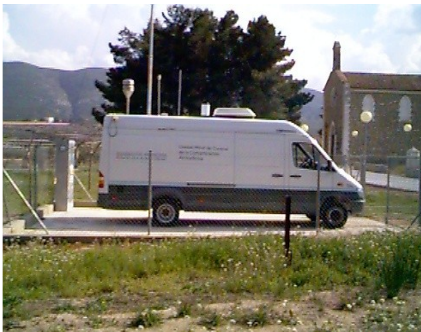
Foto: Unitat mòbil a ONTINYENT

La Xarxa Valenciana de Vigilància i Control de la Contaminació Atmosfèrica compta amb tres unitats mòbils i una Unitat d'Intervenció Ràpida, les quals, obtenen informació sobre nou emplaçaments repartits en l'àrea interior de la Comunitat Valenciana.