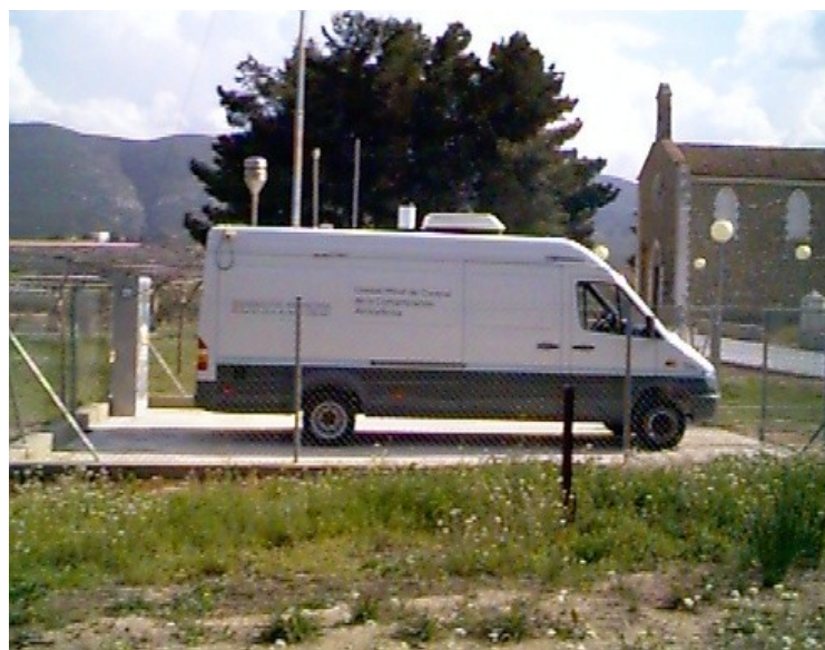
Foto: Unitat mòbil a ONTINYENT

La Xarxa Valenciana de Vigilància i Control de la Contaminació Atmosfèrica compta amb tres unitats mòbils i una Unitat d'Intervenció Ràpida, les quals, obtenen informació sobre nou emplaçaments repartits en l'àrea interior de la Comunitat Valenciana