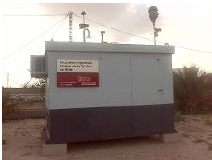
Foto: Estació a ELX-PARC DE BOMBERS

En algunes estacions es disposa a més, de sensors per a diferents paràmetres meteorològics, com la velocitat i la direcció del vent, la humitat relativa, la radiació solar, la pressió atmosfèrica i la precipitació. Aquests paràmetres són útils per a la interpretació de les dades i el coneixement de la dinàmica dels contaminants en el si de l'atmosfera.