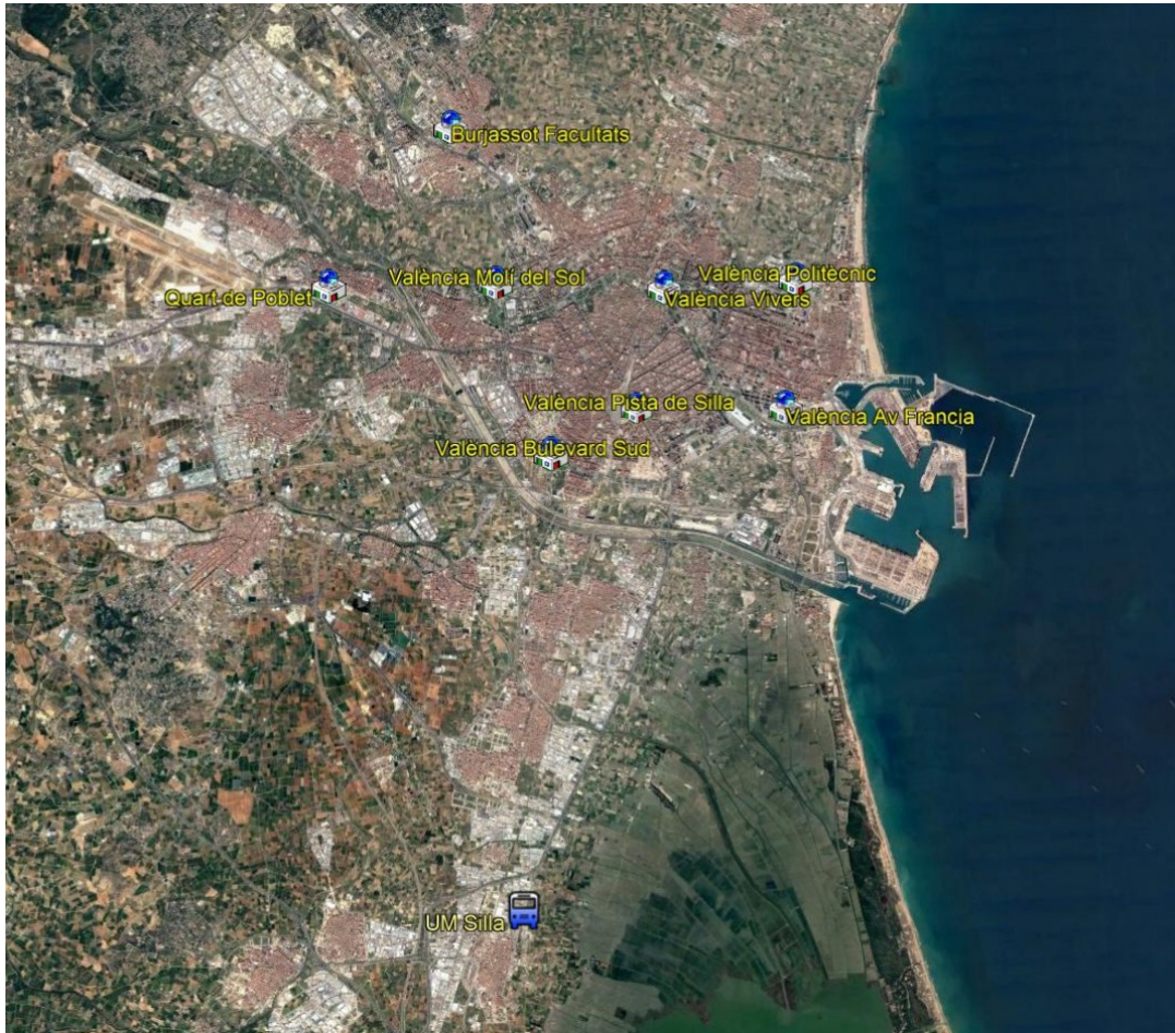
3. Vista general de la ubicación de la UM de silla.