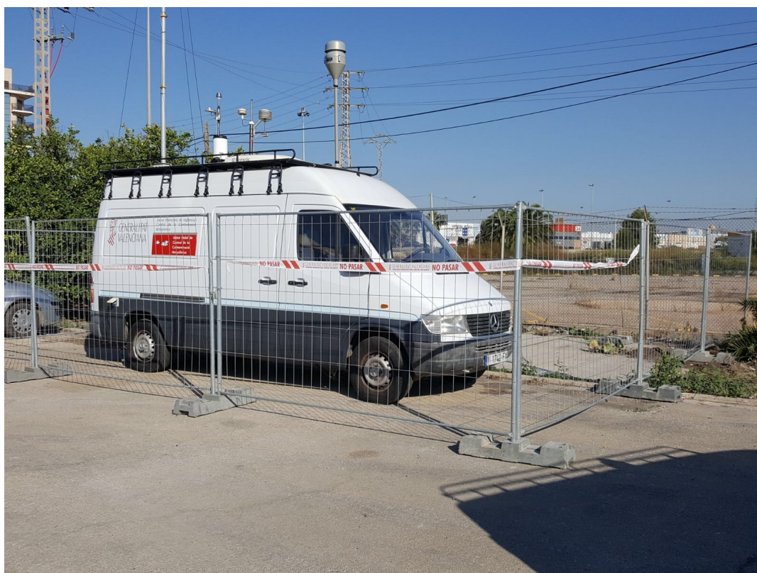
2. Ubicación de la Unidad Móvil de silla.