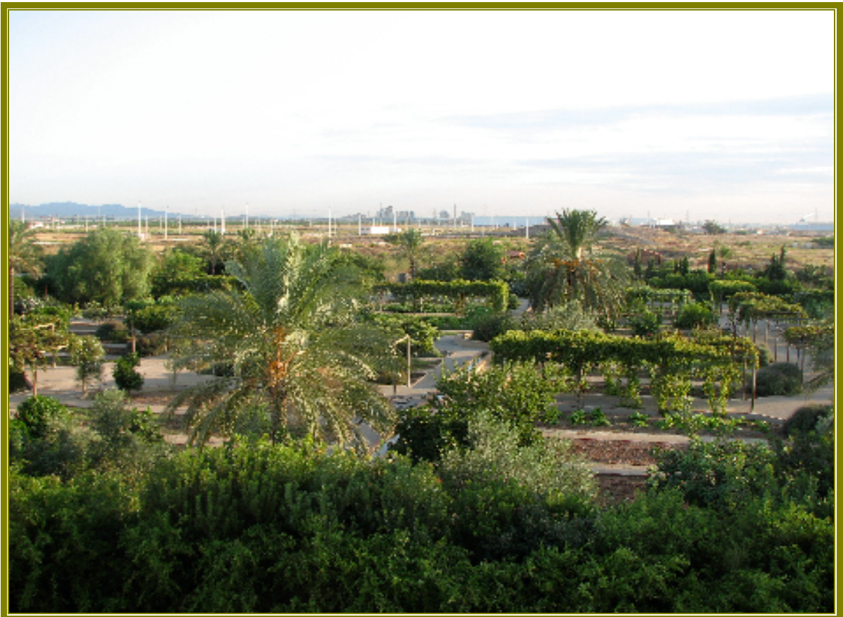
Aspecto general del Huerto.

En definitiva, para todos aquellos que todavía no conozcan este pequeño vergel, el Huerto Histórico del CEACV es, a partir de ahora,