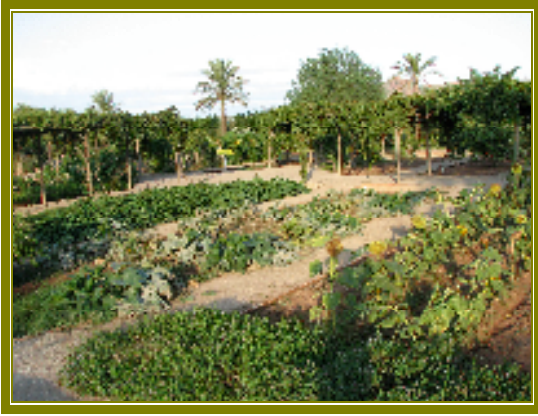
Aspecto parcial del Huerto.

una parada obligada, un espacio en el que aprender y disfrutar de los aromas, los colores y los sonidos, de placeres y sensaciones olvidadas, que a muchos nos hacen recordar vivencias de un pasado no muy lejano.