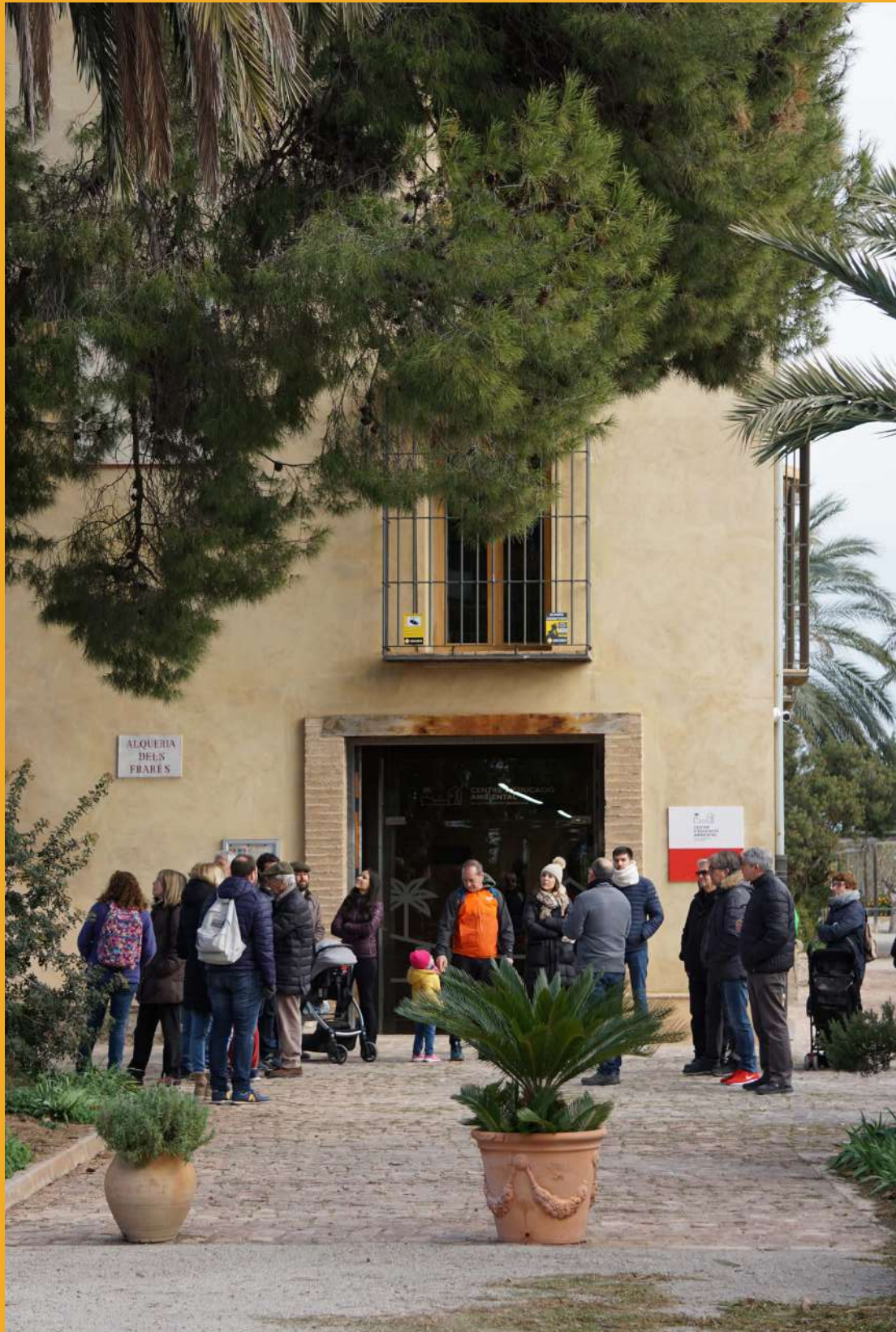
Centre educació Ambiental de la Comunitat Valenciana