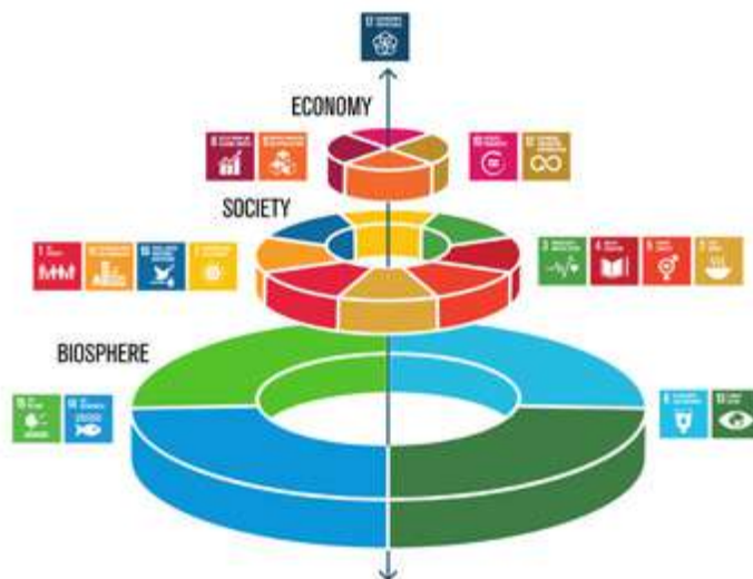
The SDGs wedding cake. Stockholm Resilience Center

I tot això sense oblidar que en aquests moments és especialment important donar al conjunt dels ODS l'enfocament que aporta l'Stockholm Resilience Center a través del seu wedding cake, per a construir societat i economia sobre la base de la conservació i cura de la biosfera. L'èxit de l'Agenda 2030 de les Nacions Unides requereix noves vies de relacionar-nos amb les persones i el planeta, vies basades en la participació, la col·laboració i la implicació ciutadana. En aquest sentit, l'educació ambiental és una eina poderosa per a impulsar la cooperació entre tots els actors implicats.