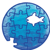
PÉRDIDA DE LA BIODIVERSIDAD