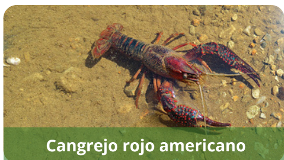
Cangrejo rojo americano

La caña ( Arundo donax ) es una planta herbácea de la familia del bambú, originaria de Asia. Se extiende por ríos, acequias, humedales, etc., gracias a sus rizomas subterráneos. Supone una amenaza para la conservación de carrizales, tarayales u olmedas.