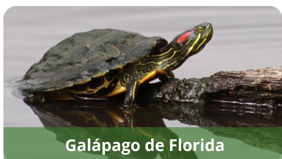
Galápago de Florida

El cangrejo rojo americano ( Procambarus clarkii ) es un crustáceo originario del sureste de EEUU. Se encuentra en aguas no demasiado frías, como ríos de curso lento, marismas, estanques, sistemas de riego y campos de arroz. Supone una amenaza para la conservación del cangrejo europeo.