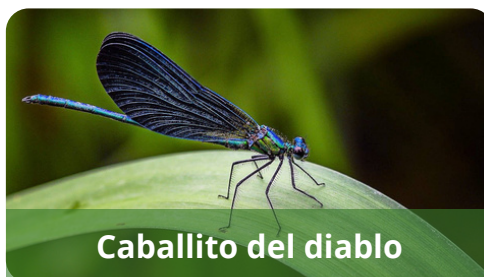
Caballito del diablo

Los cursos de agua también son importantes para el grupo de los anfibios, que en el caso de la rana común ( Pelophylax perezi ) tendrá mayor dependencia mientras que en el caso de los sapos la dependencia es mínima limitándose a la utilización del medio acuático para la reproducción. El sapo corredor ( Epidalea calamita ) y el sapo común ( Bufo bufo ) son habitantes frecuentes de estas zonas.