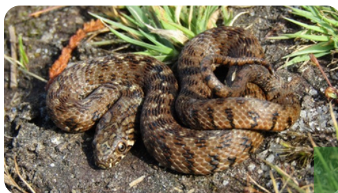
Culebra de agua

Los reptiles también están representados. La culebra viperina ( Natrix maura ) se acerca a los cursos de agua en busca de presas.