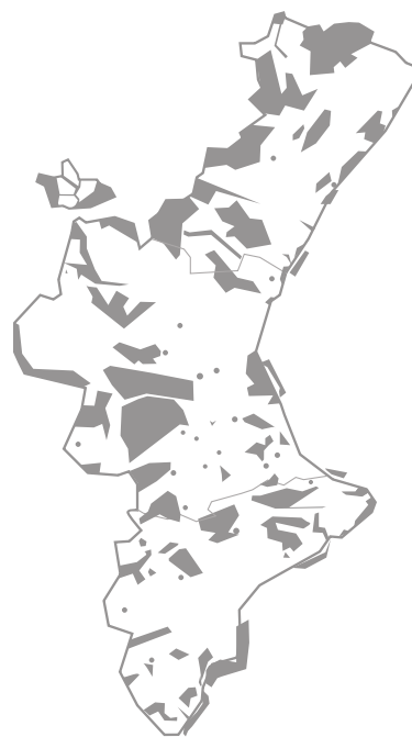
nueva propuesta de LICs