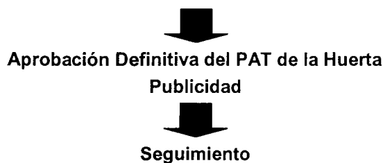
Figura 02.- Proceso de tramitación ambiental del PAT de la Huerta