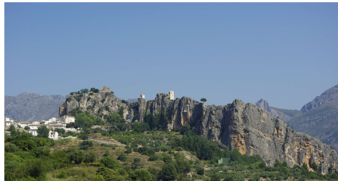
El Castell de Guadalest

Plantear procesos de planificación territorial con la participación activa de los ciudadanos y de las administraciones.