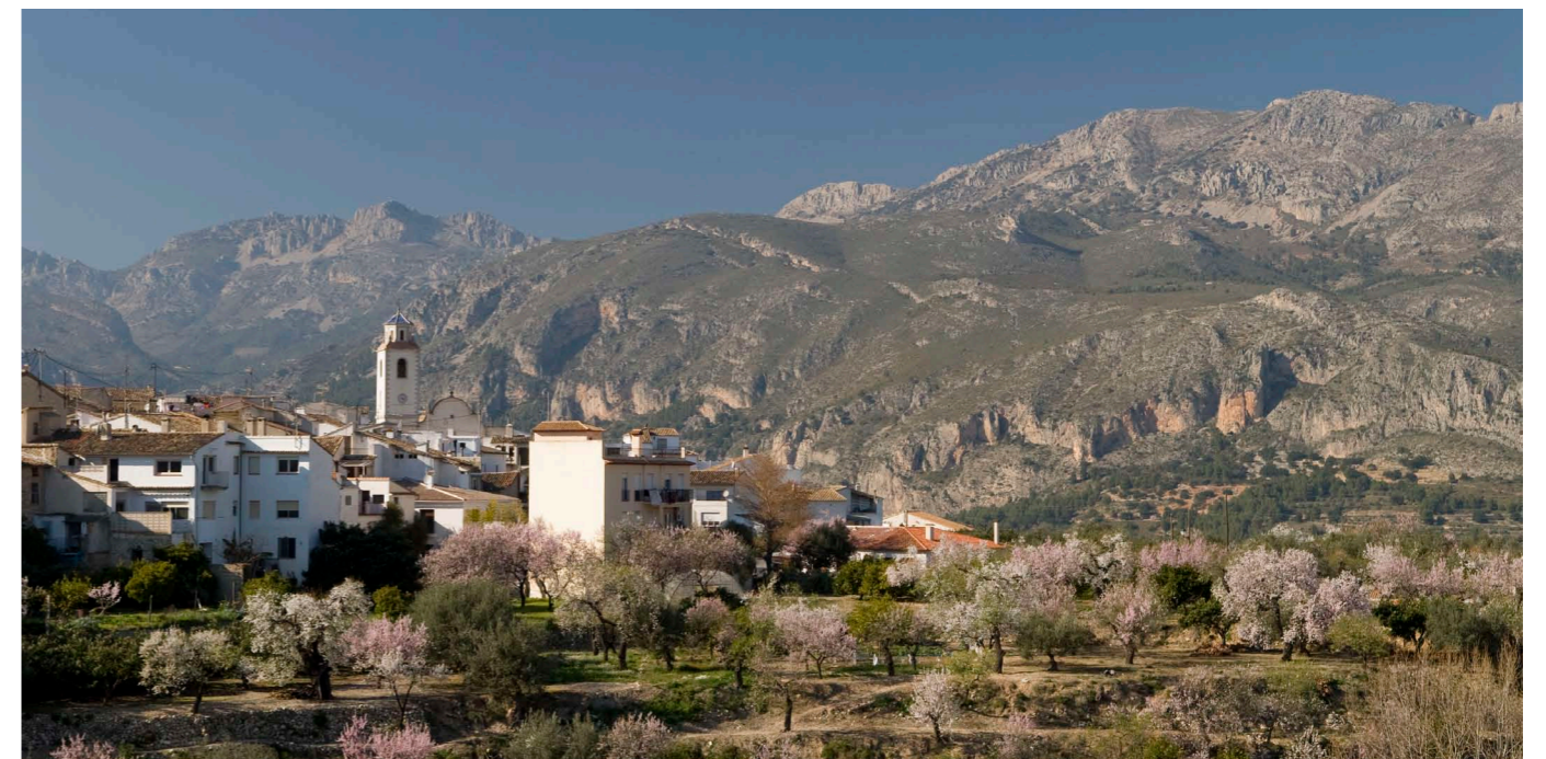
Fondo escénico y núcleo urbano

INFORME DE SOSTENIBILIDAD AMBIENTAL (ISA)