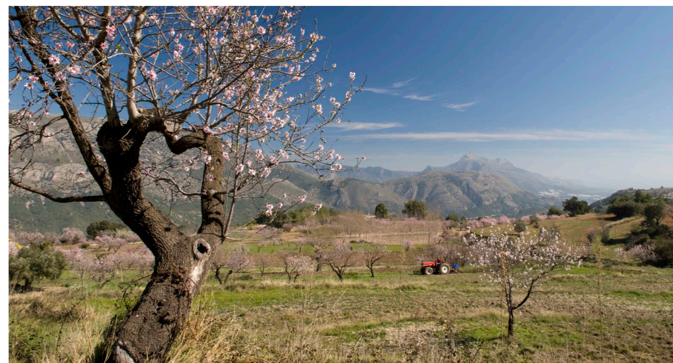
Imagen del Valle