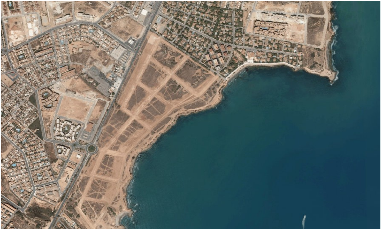
Ortofoto 2. Sector D-1 "Alameda del Mar", any 2007 .