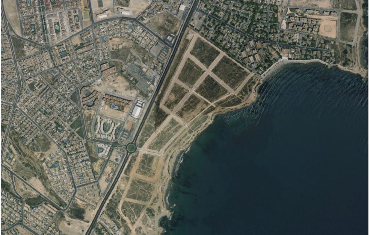
Ortofoto 3. Sector D-1 "Alameda del Mar", any 2009.