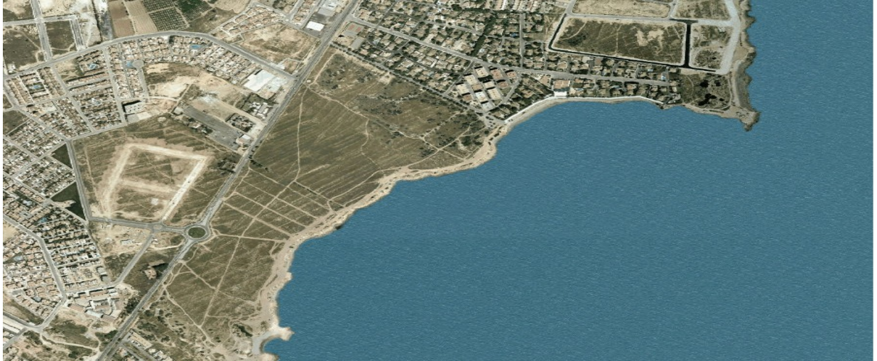
Ortofoto 1. Sector D-1 "Alameda del Mar", any 2002 .