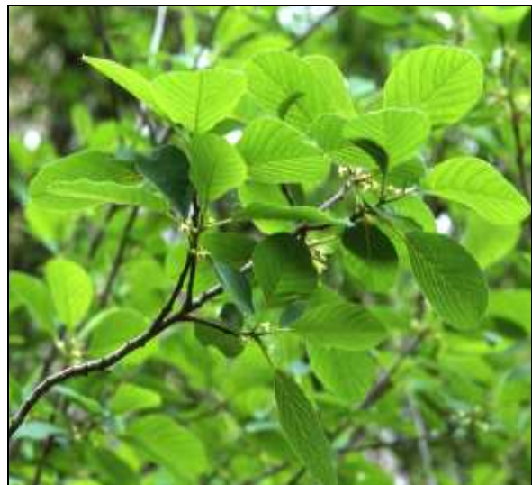
El gran tamaño que presentan las hojas de Frangula alnus subsp. baetica es uno de los caracteres diferenciadores de mayor peso para separar taxonómicamente esta subespecie.

Ante la escasez de ejemplares y la reiterada referencia a la falta de rebrote y mala respuesta a la propagación vegetativa de F. alnus subsp. alnus , taxon más cercano de referencia para la subsp. baetica , se planteó la opción inicial de obtener protocolos de producción de planta mediante micropropagación in vitro a partir de yemas vegetativas, desarrollada desde el IVIA en colaboración con el CIEF. Sorprendentemente, a diferencia de lo recogido para trabajos similares con la subsp. alnus , la técnica de la propagación clonal in vitro resultó exitosa desde el primer momento, habiéndose obtenido un protocolo depurado y más de 450 nuevos ejemplares clonales. En paralelo se comprobó que los especímenes de Jalance producían rebrotes basales como respuesta a la corta de ramas en su hábitat natural, lo que constituye una constatación adicional de las diferencias con la subsp. alnus ; en el mismo sentido, contactando con los equipos técnicos de la Junta de Andalucía que trabajan paralelamente en la recuperación de las poblaciones andaluzas, se corroboró que las plantas de la subsp. baetica exhiben allí también la misma capacidad de rebrote y de propagación vegetativa. El buen comportamiento de la especie in vitro había pensado que la planta podría ser susceptible de propagación vegetativa por esquejado, vía más lenta y con mero producción de ejemplares.