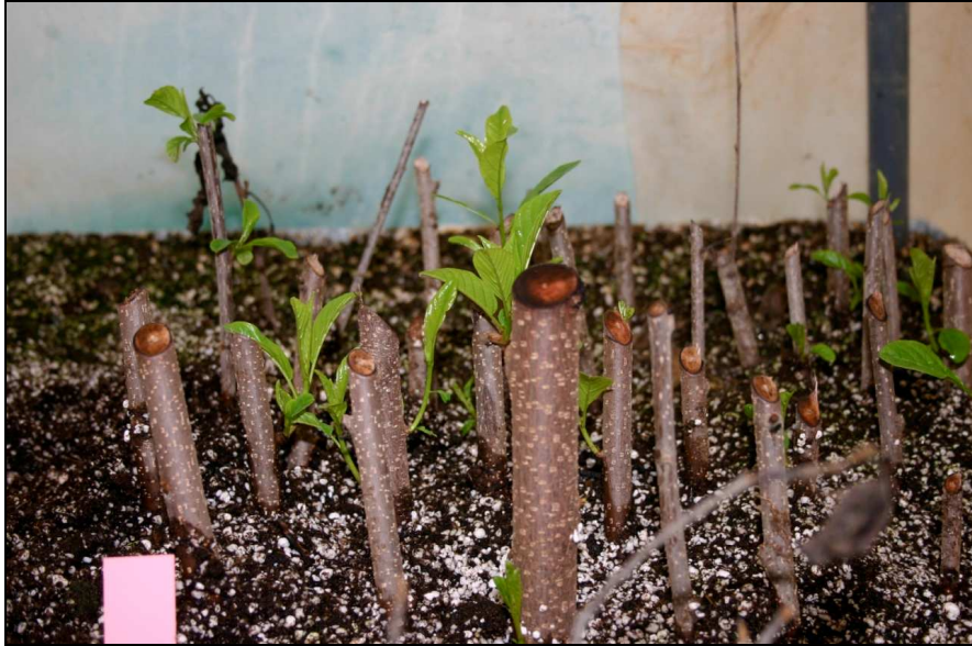
Estaca de Frangula alnus subsp. baetica en fase de enraizamiento dentro de la cámara caliente. Foto: P.P. Ferrer, enero 2010