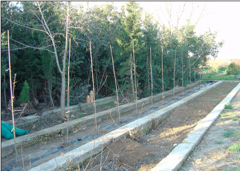
Banco clonal y huerto productor de semillas de Frangula alnus subsp. baetica instalado en el CIEF.

En las últimas semanas se ha iniciado formalmente la creación del banco clonal de Frangula alnus subsp. baetica en el CIEF. Por el momento dicho banco consta ya de 15 ejemplares del clon \alpha 1CB (procedente de la micropropagación clonal desarrollada por el IVIA), todos en suelo, con marco de plantación 1,5 m, dispositivo de riego y bajo condiciones de sombra moderada. Están reservadas a su lado las eras que deberán acoger progresivamente a los ejemplares clonados de estaquilla a partir del resto de especímenes naturales de la población de Jalance.