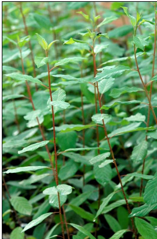
Ejemplares de F. alnus subsp. baetica producidos en el IVIA y transferidos al CIEF.

La intención del banco clonal es generar un huerto de progenies, albergando una réplica de cada uno de los ejemplares que se conocen para esta especie en el territorio valenciano. A partir del material del huerto clonal, pueden obtenerse a medio plazo nuevos esquejes sin producir daños a los ejemplares nativos de las subpoblaciones de Jalance.