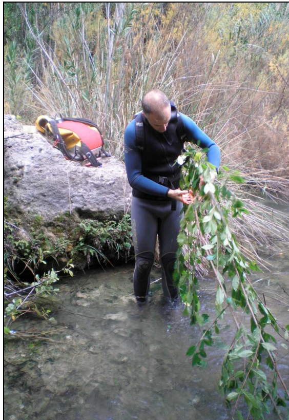
Recolección de estacas de Frangula alnus subsp. baetica de la población de Albolota (Jalance) para la multiplicación vegetativa en cámara caliente.

En el otoño de 2009 se procedió a la recolección de material vegetal para iniciar las pruebas de esquejado, lo que requirió la colaboración de especialistas en barranquismo y técnicas de escalada, dada la inaccesibilidad de la gran mayoría de ejemplares localizados hasta el momento. Posteriormente se inició la fase de propagación por esquejado mediante el método de 'cama caliente' o 'cámara caliente', manteniendo las estaquillas en medio de cultivo húmedo y con calor radiante, sometido a riego regular por nebulización.