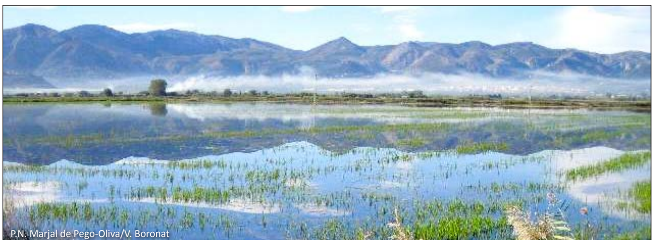
P.N. Marjal de Pego-Oliva/V. Boronat