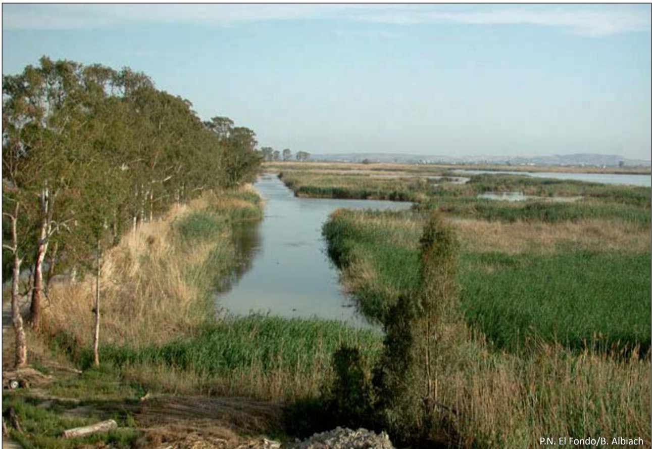
P.N. El Fondo/B. Albiach