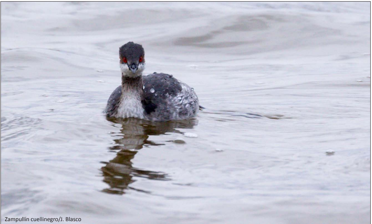
Zampullín cuellinegro/J. Blasco