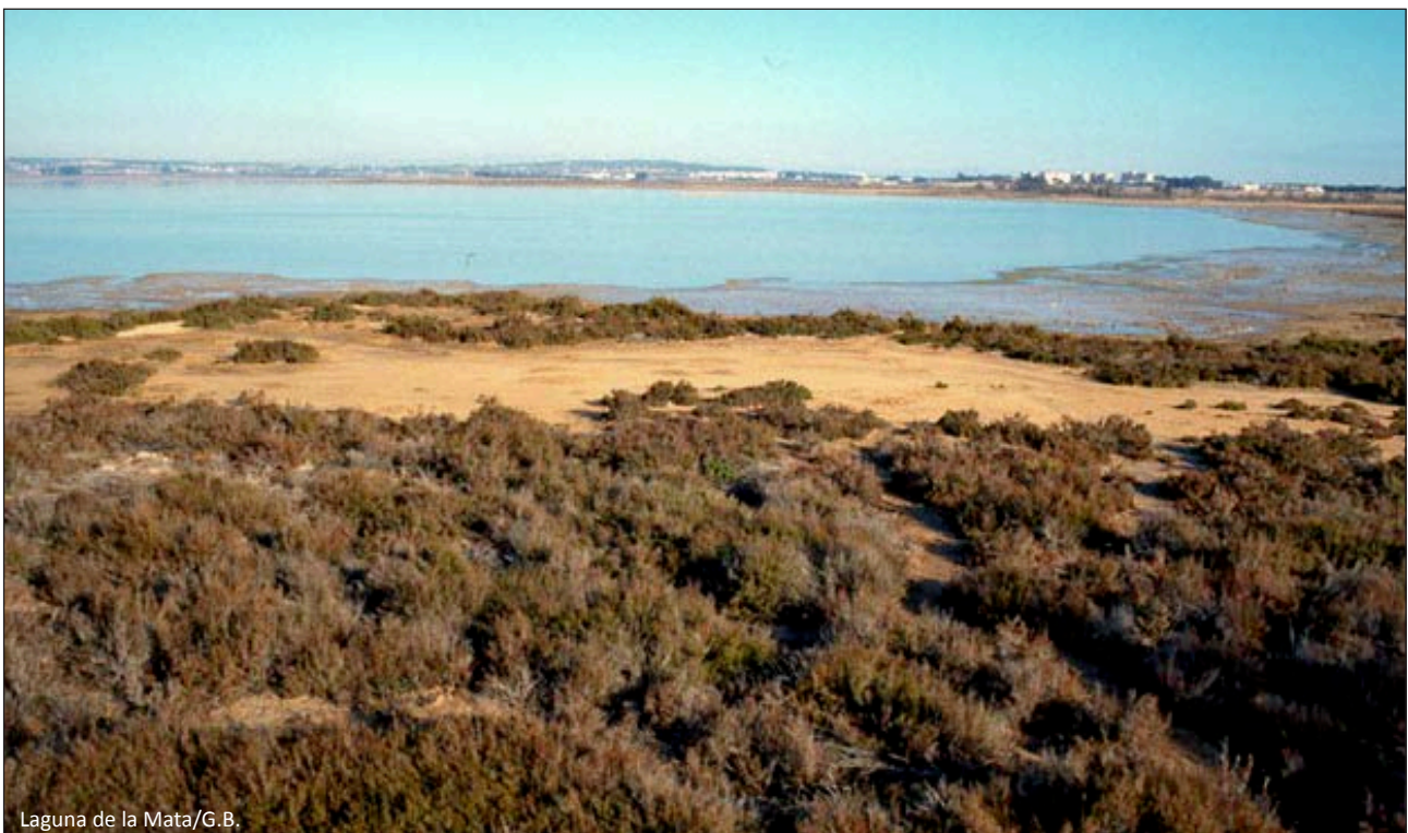
Laguna de la Mata