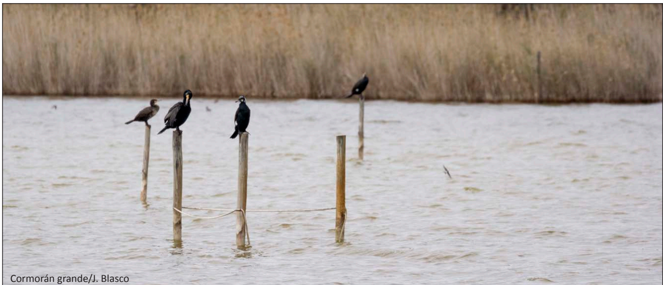
Cormorán grande