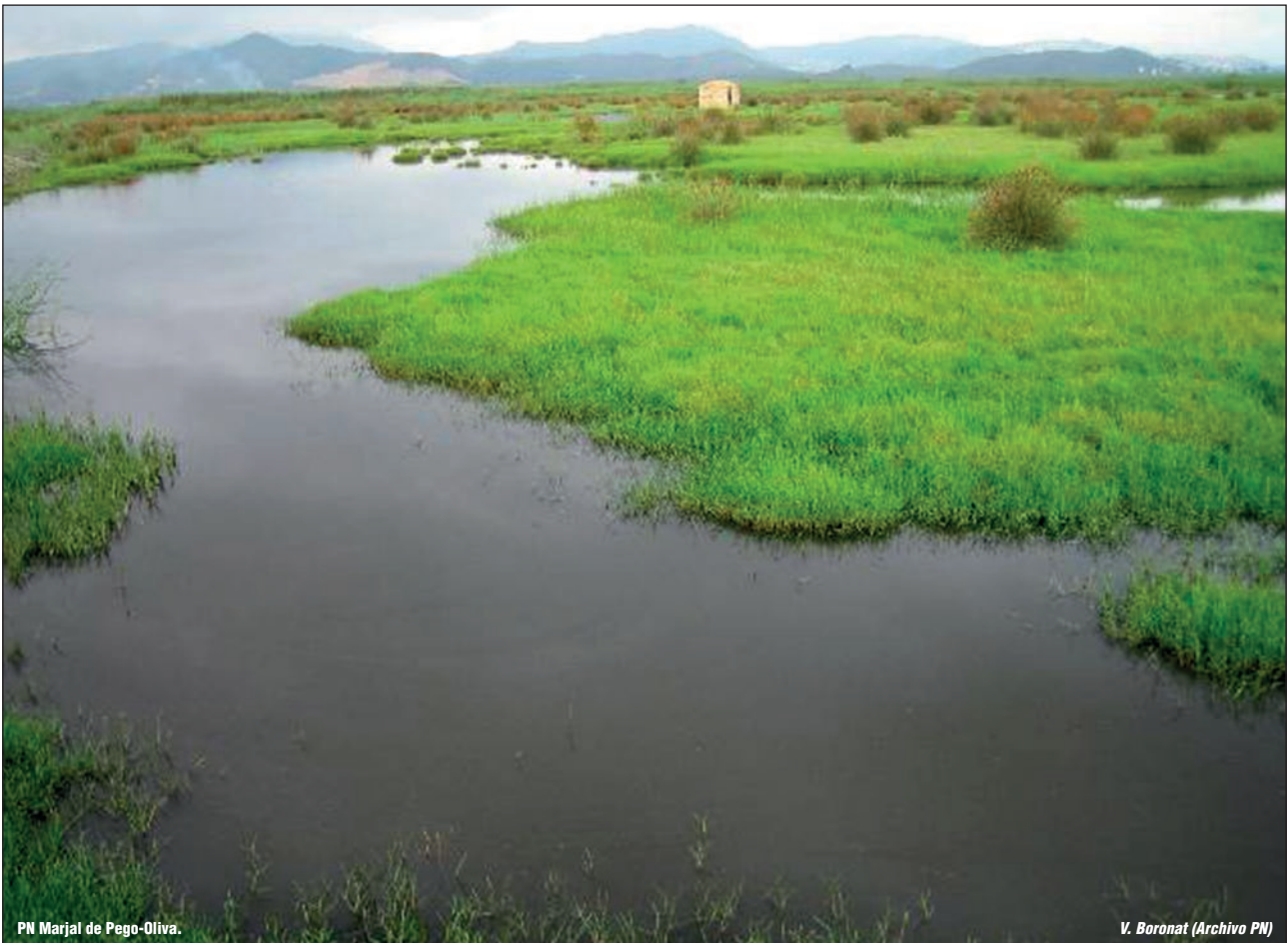
PN Marjal de Pego-Oliva.