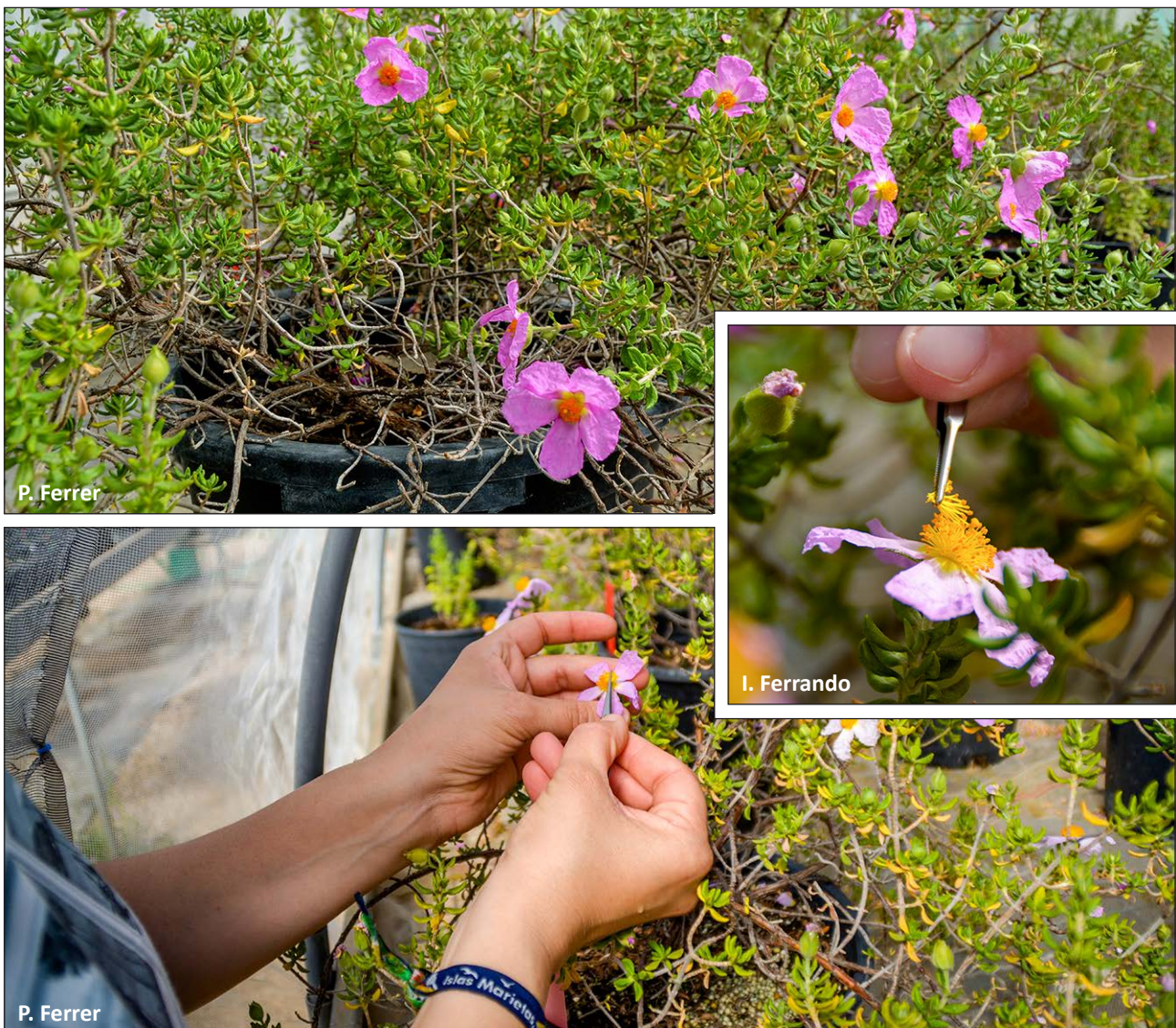
Figura 1. Cruzamientos realizados para la obtención de material vegetal de reproducción sexual entre líneas de plantas madre cultivadas en el CIEF.

Los tipos de cruzamiento que han dado mayor rendimiento (mejor relación cantidad/calidad de semillas), son los realizados entre plantas procedentes de la germinación de semillas como receptoras de polen y las procedentes de multiplicación vegetativa por esqueje como donantes de polen (Figura 1). La selección de estos cruces ha sido resultado de los experimentales realizados desde el año 2012.