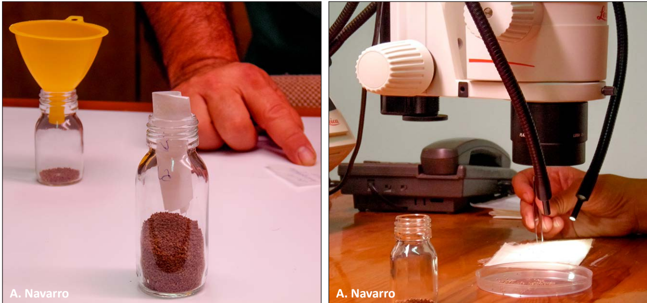
Figura 4. Lotes de semillas de Cistus heterophyllus subsp. carthaginensis procedentes sólo de material valenciano.