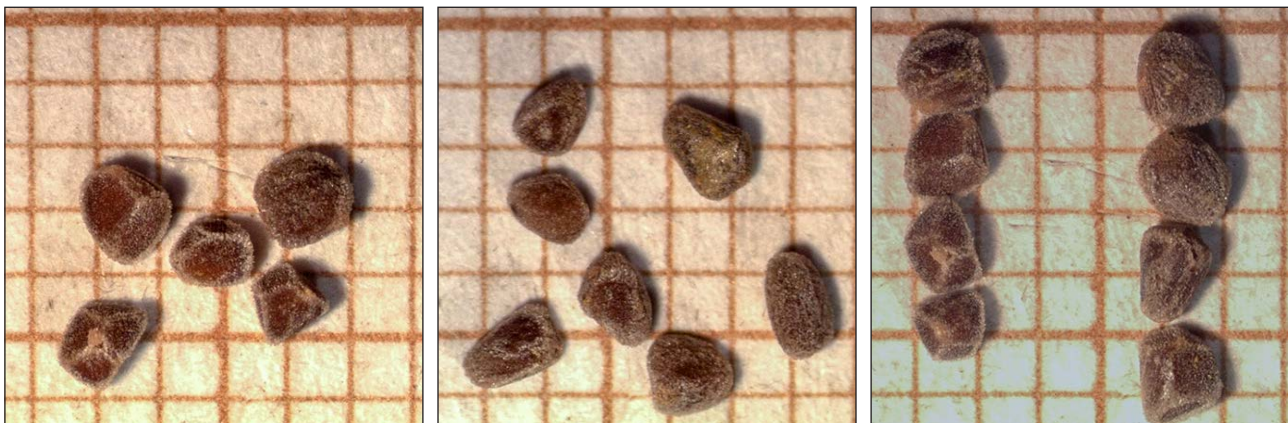
Figura 5. Semillas de Cistus heterophyllus subsp. carthaginensis procedentes de plantas originadas a partir de semilla (izquierda), de esquejado (centro) y ambas juntas (derecha, obsérvese la diferencia de tamaño según el origen, siendo las más pequeñas las de semilla).

La producción media de semillas es 11,9 semillas/fruto en el caso de plantas esquejadas frente a 37,6 semillas/fruto para las plantas de semilla, un dato que corrobora los resultados obtenidos en el año 2015 para el mismo cruce habiéndose obtenido una producción media de 36,9 semillas/fruto (ejemplares procedentes de esqueje como donantes de polen y ejemplares procedentes de la germinación de semilla como receptores de polen).