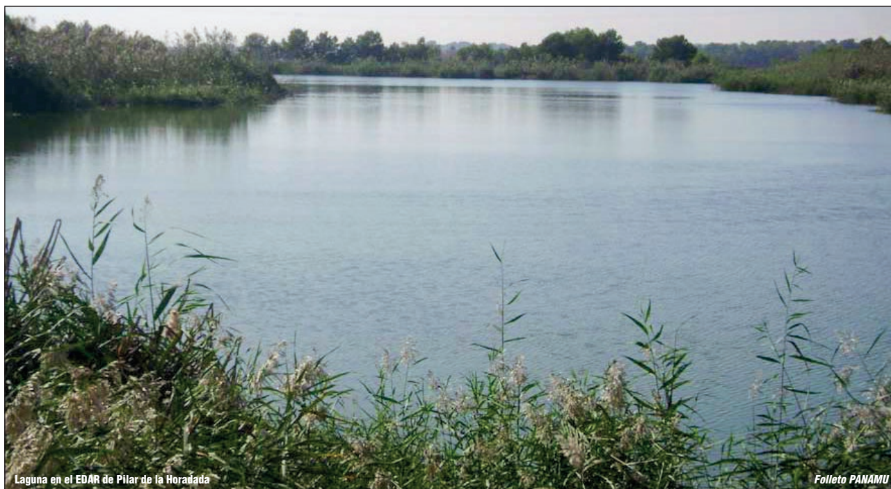
Laguna en el EDAR de Pilar de la Horadada