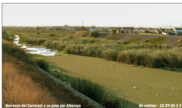
Barranco del Carraixet a su paso por Alboraya