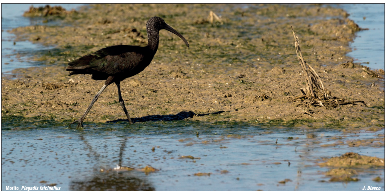
Morito_ Plegadis falcinellus