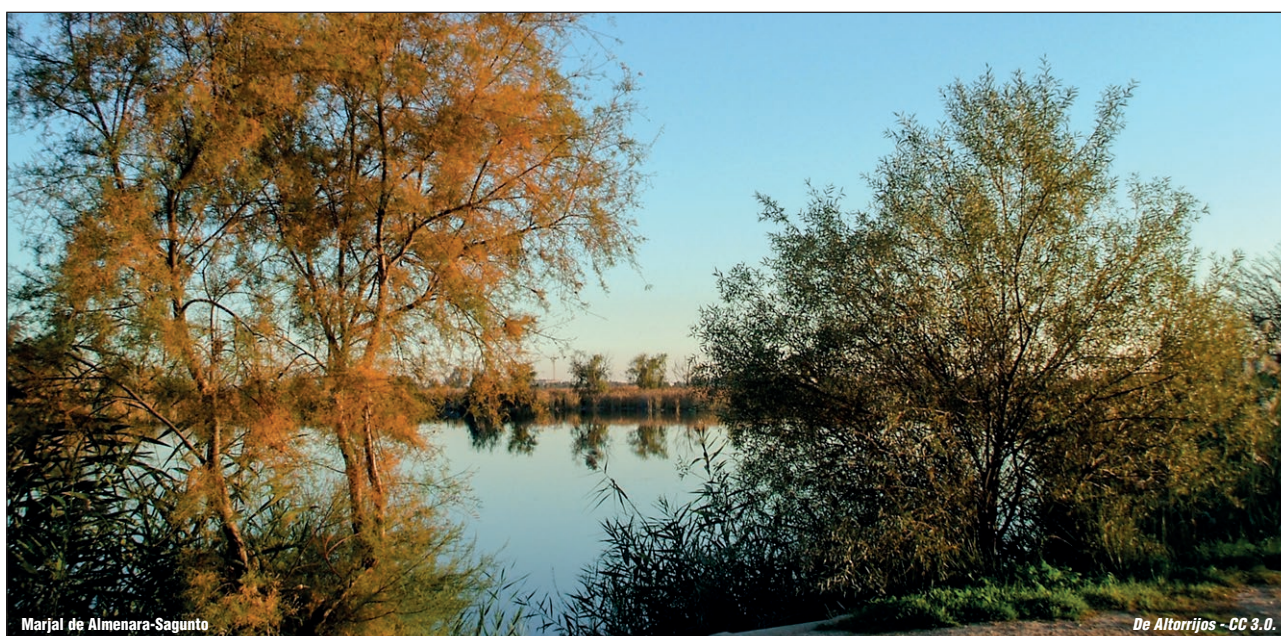
Marjal de Almenara-Sagunto