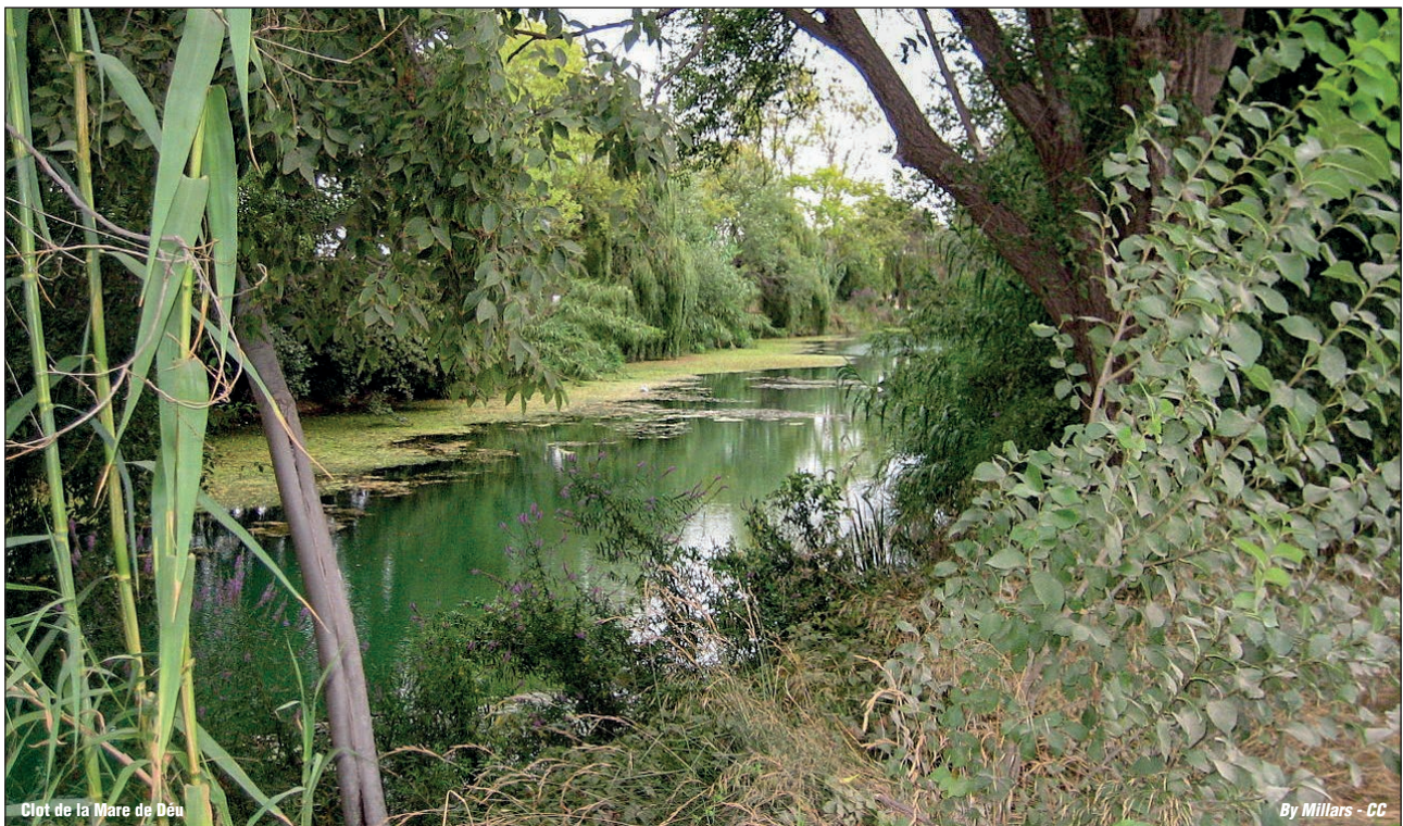
Clot de la Mare de Déu