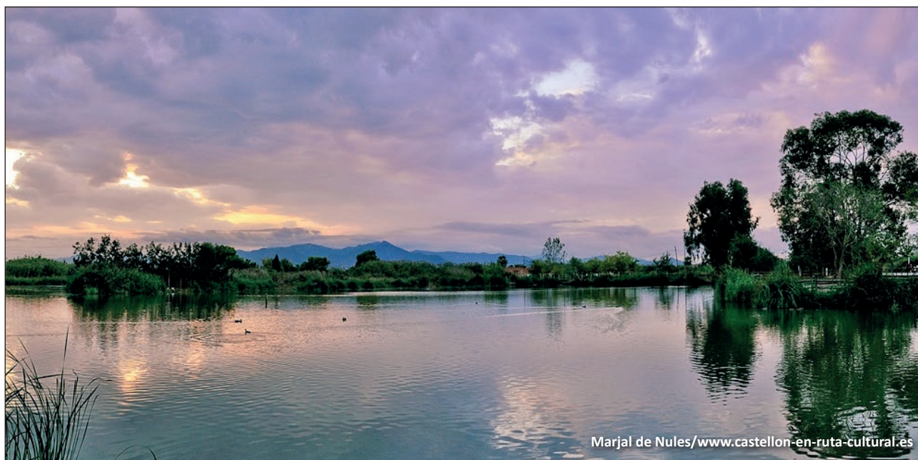
Marjal de Nules/ www.castellon-en-ruta-cultural.es