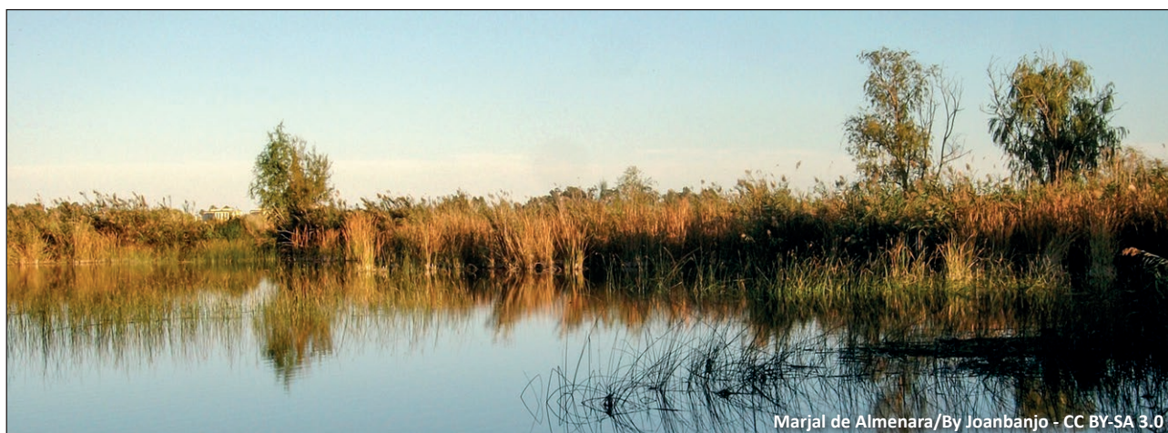
Marjal de Almenara