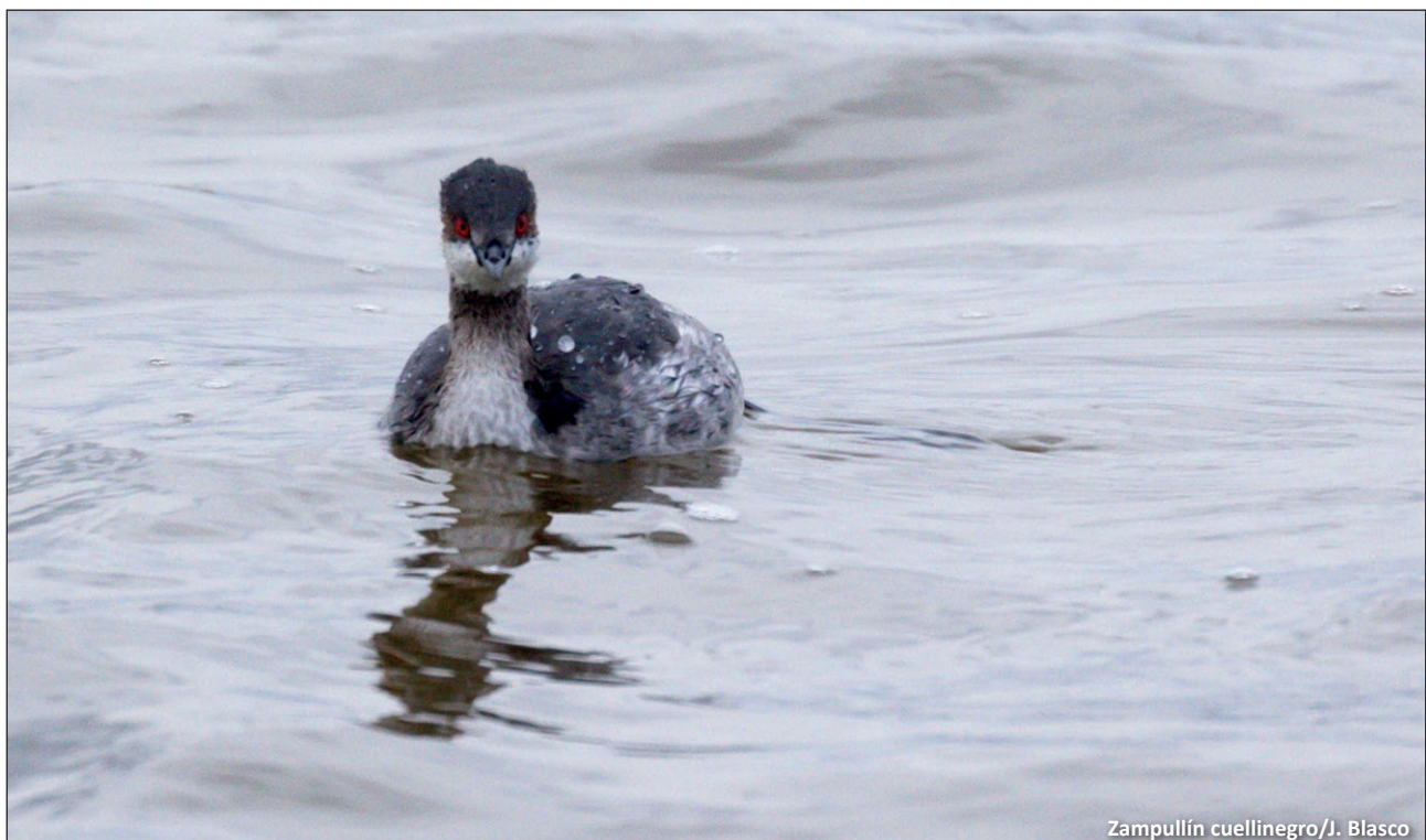
Zampullín cuellinegro/J. Blasco