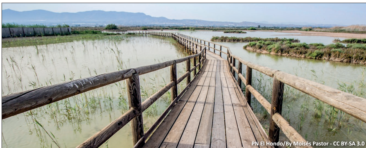
PN El Hondo