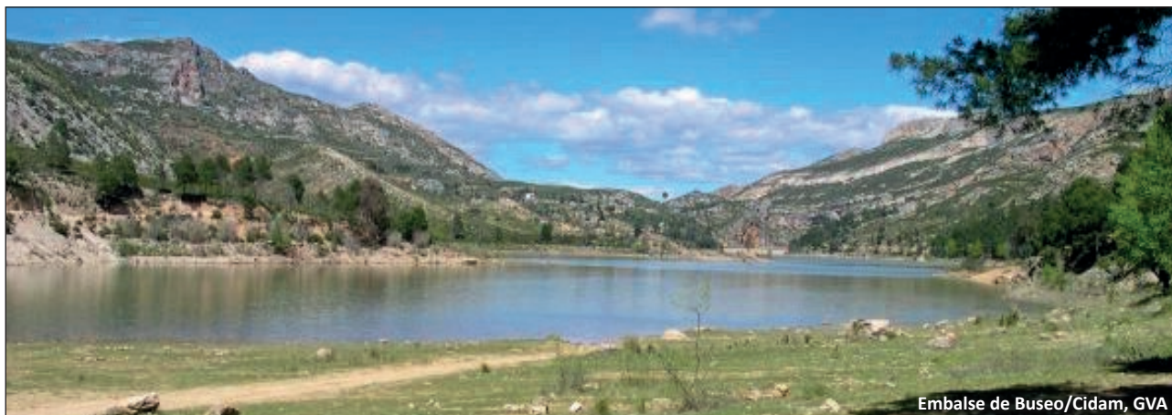
Embalse de Buseo/Cidam, GVA