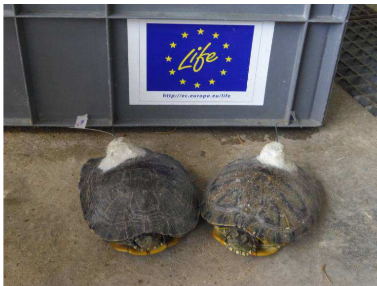
Figura 1: Hembras de Trachemys con los emisores en el caparazón (Gandia).

Se colocaron emisores modelo TW-3 de Biotrack® y la recepción de la señal se hizo mediante un receptor "Sika" con frecuencias de 149 y 150 Mhz y una antena Yagi flexible direccional de tres elementos de unos 800 g. Todos los elementos proceden de Biotrack®.