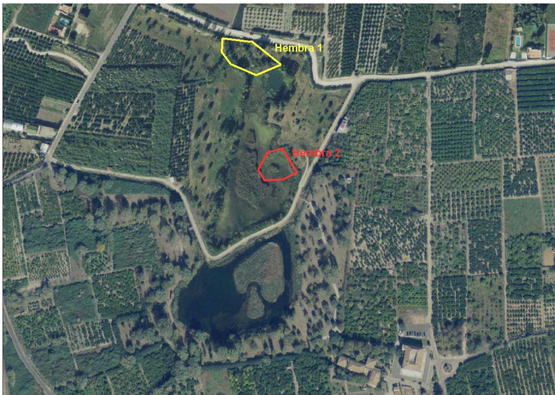
Figura 3: Zona de hibernación de las hembras seguidas en el ullal de la Perla (Gandia)

En la figura 3 se muestra una ortofoto de la zona donde se ha marcado con un polígono las zonas donde cada uno de los ejemplares seguidos ha pasado la mayor parte del tiempo.