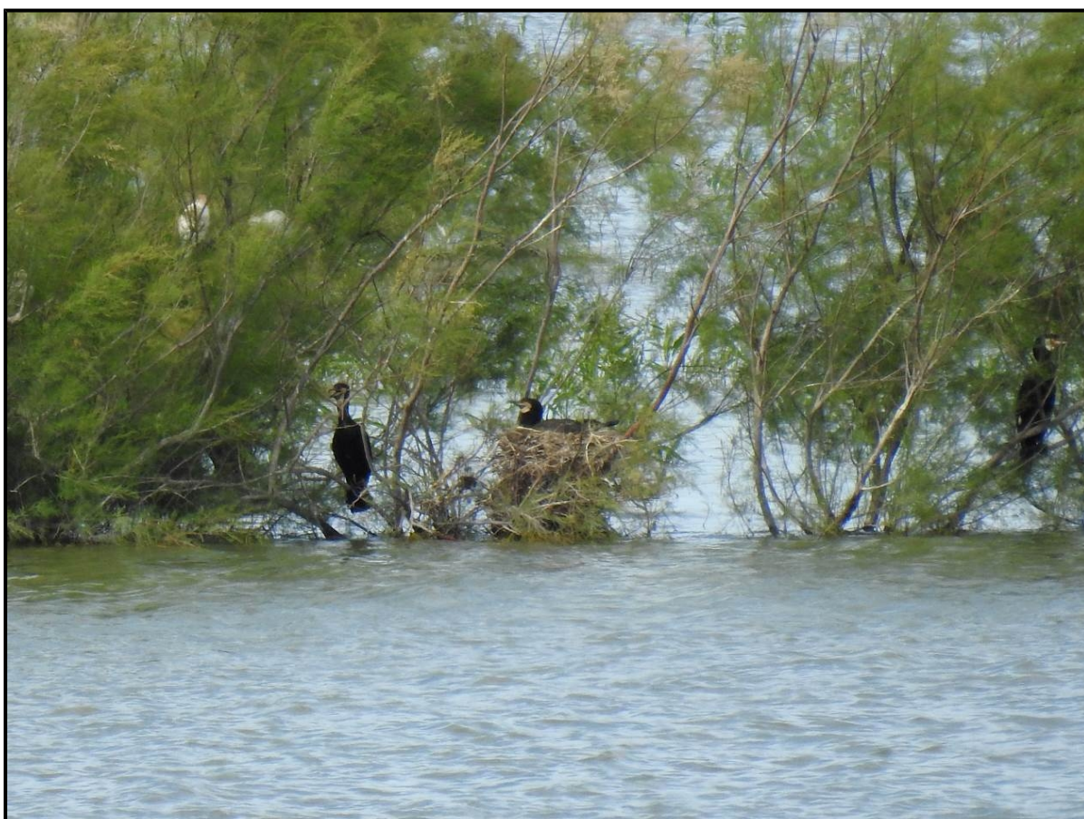
Nido de cormorán grande detectado en 2021 en el Embalse de Bellús. Autor: J. Boronat.