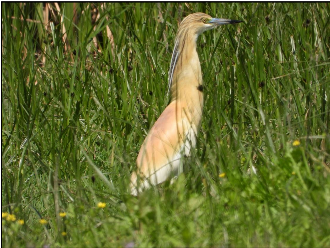
Garcilla cangrejera. Autor: F. Cervera.