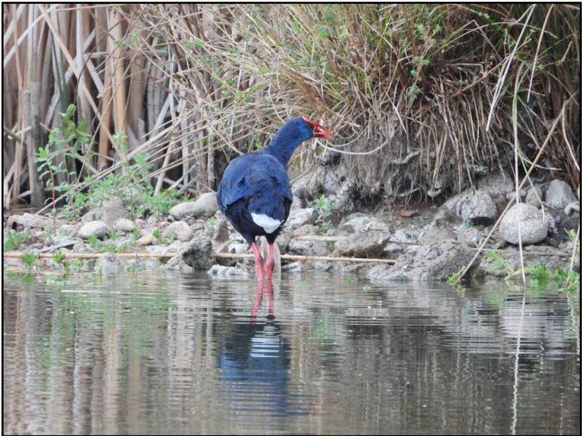
Calamón común. Autor: A. García.