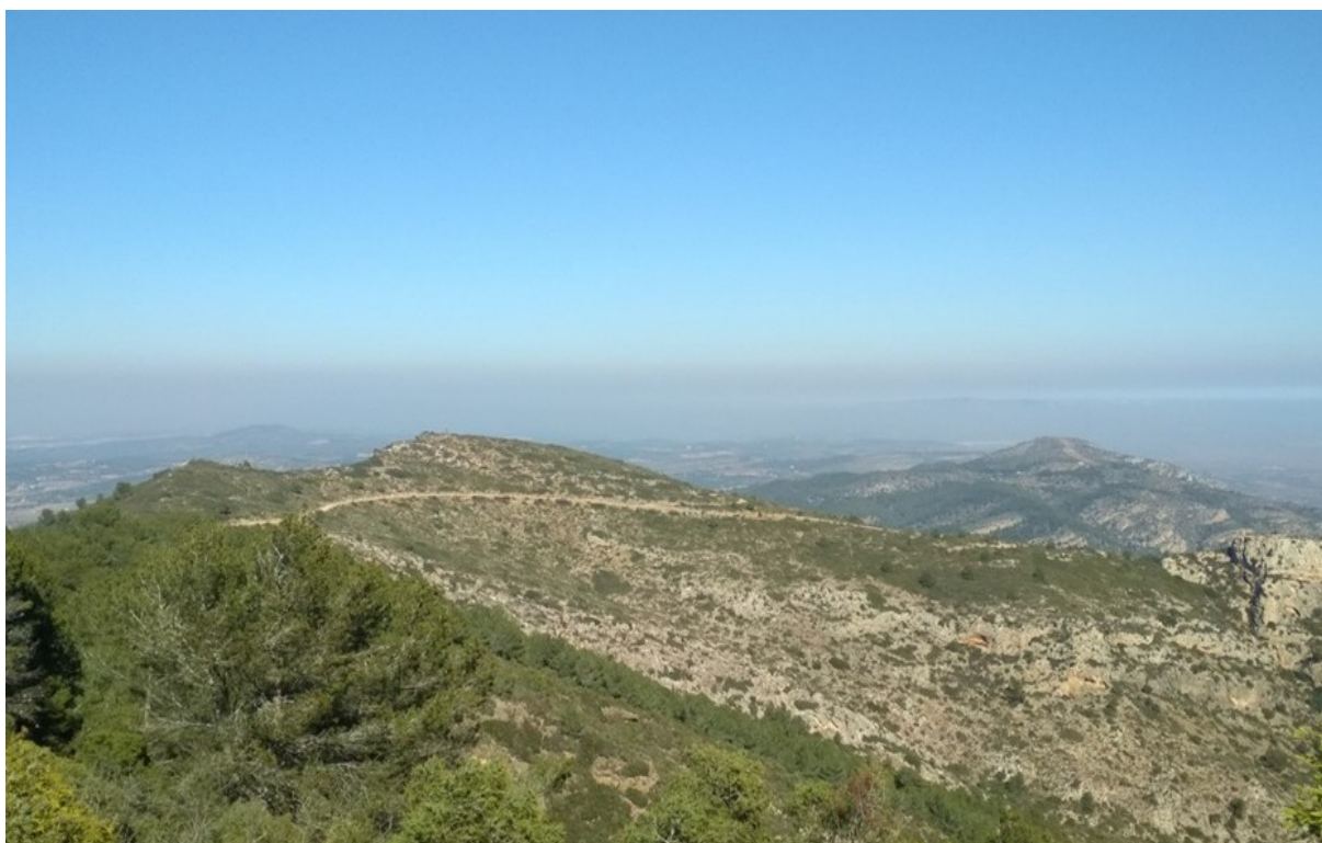
Vista general de la microrreserva en la que se aprecian los hábitats más representativos que se desarrollan en los suelos rocosos calizos.