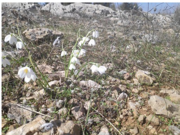
Acis valentina , endemismo iberolevantino de floración otoñal catalogado como Vulnerable , que crece sobre terrenos rocosos calizos y cuenta con varias poblaciones en la provincia de Castellón.

Erodium aguilellae (P, E, R) Erodium sanguis-christi (E, R) Guillonea scabra (E) Helianthemum organifolium subsp. glabratum (E) Rhamnus lycioides (E) Satureja innota (E)