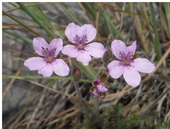
Erodium aguilellae , endemismo de la provincia de Castellón distribuido por las sierras litorales y prelitorales. Forma parte de los matorrales bajos y pastizales vivaces sobre suelos calizos pedregosos.