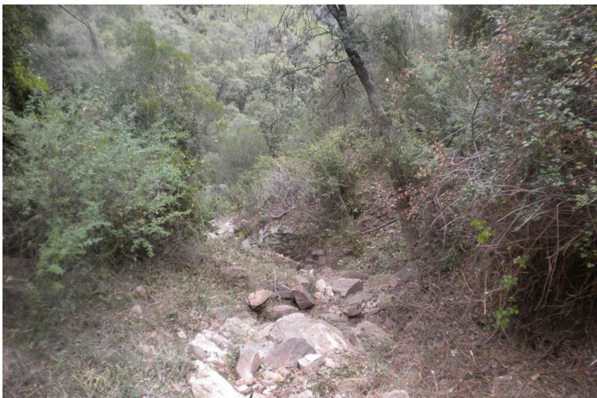
Aspecte de la microreserva des de la part inferior on s'aprecia el llit sec del barranc que discorre entre sureres.