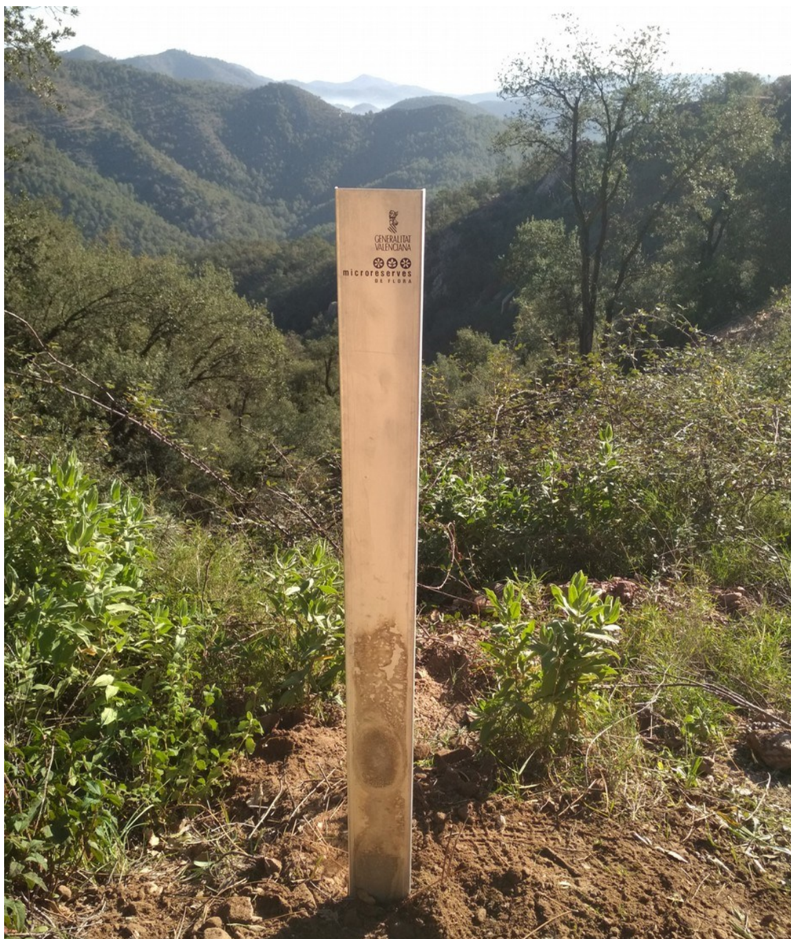
Aspecto del barranco desde la parte superior donde se aprecia el espléndido alcornocal.

http://www.docv.gva.es/datos/2001/02/01/pdf/2001_673.pdf