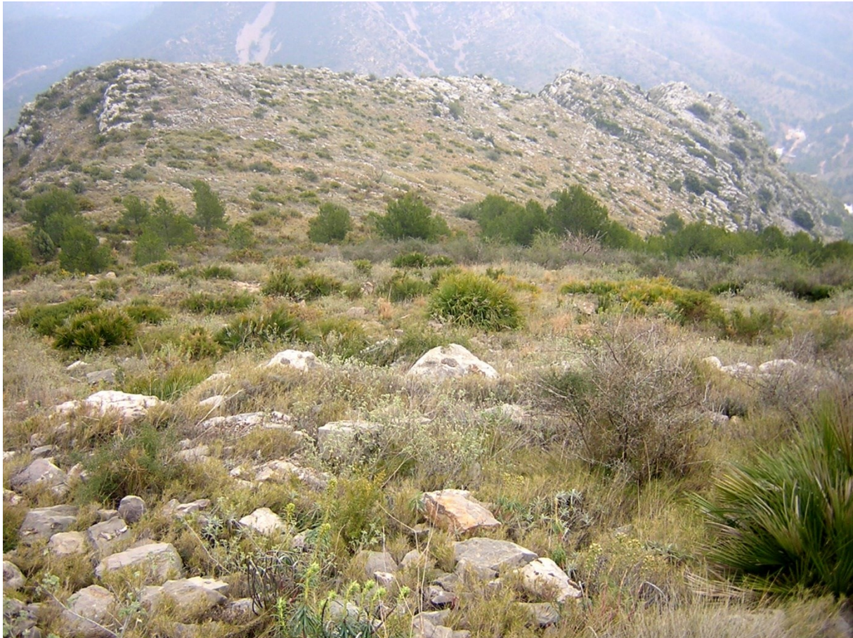
Els prats secs són els hàbitats idonis per a l'endemisme valencià Acis valentina .