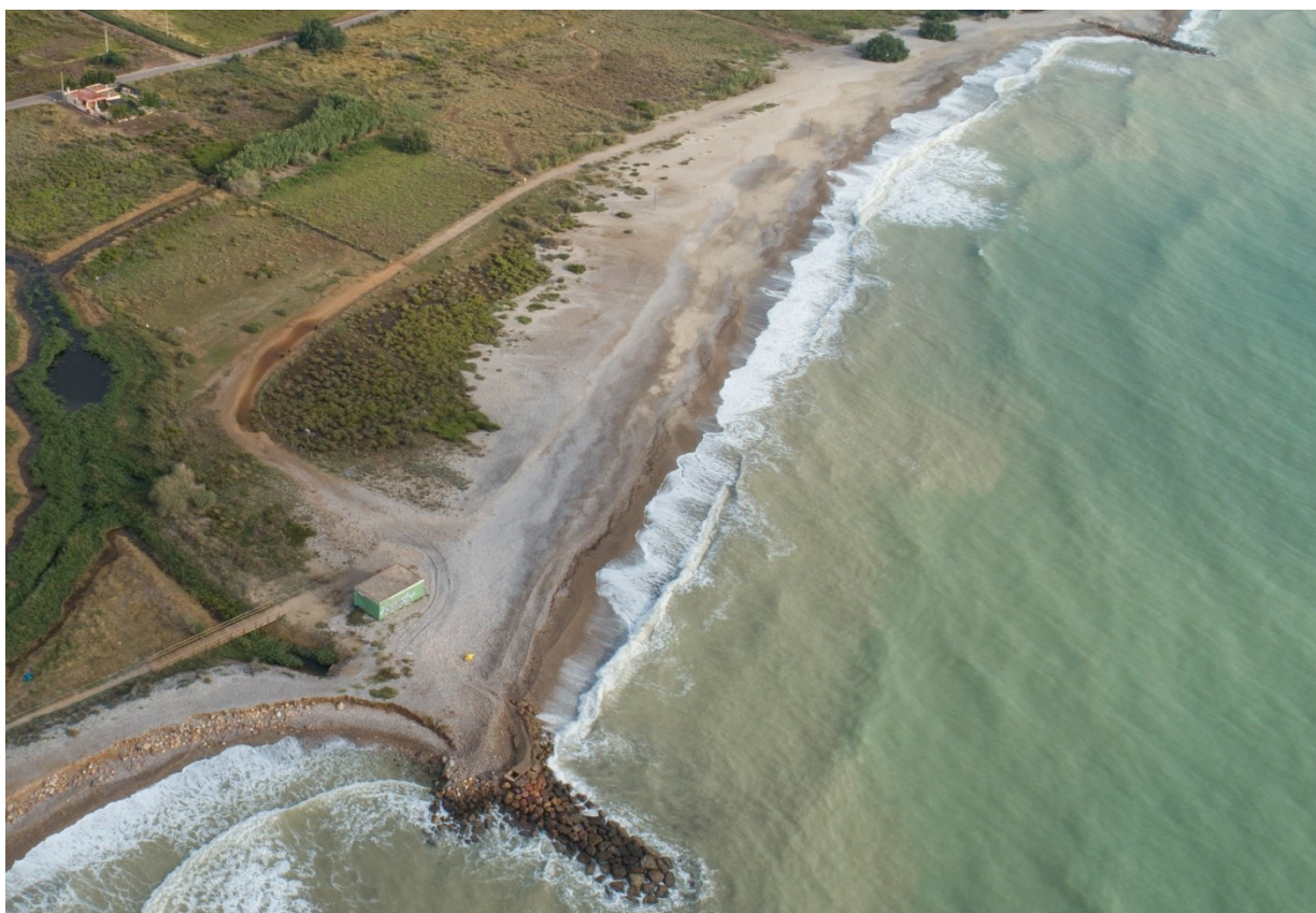
Panorámica de la microrreserva.