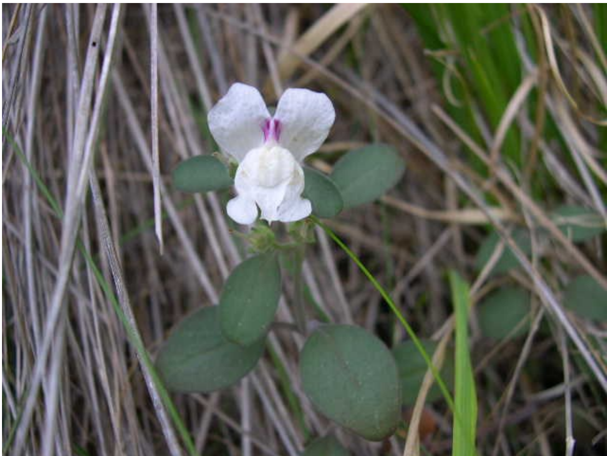
Antirrhinum pertegasii és un endemisme de l'est de la península Ibèrica, restringit als Ports de Beseit i Tortosa (massís del Port), a la confluència de les províncies de Castelló, Tarragona i Terol.