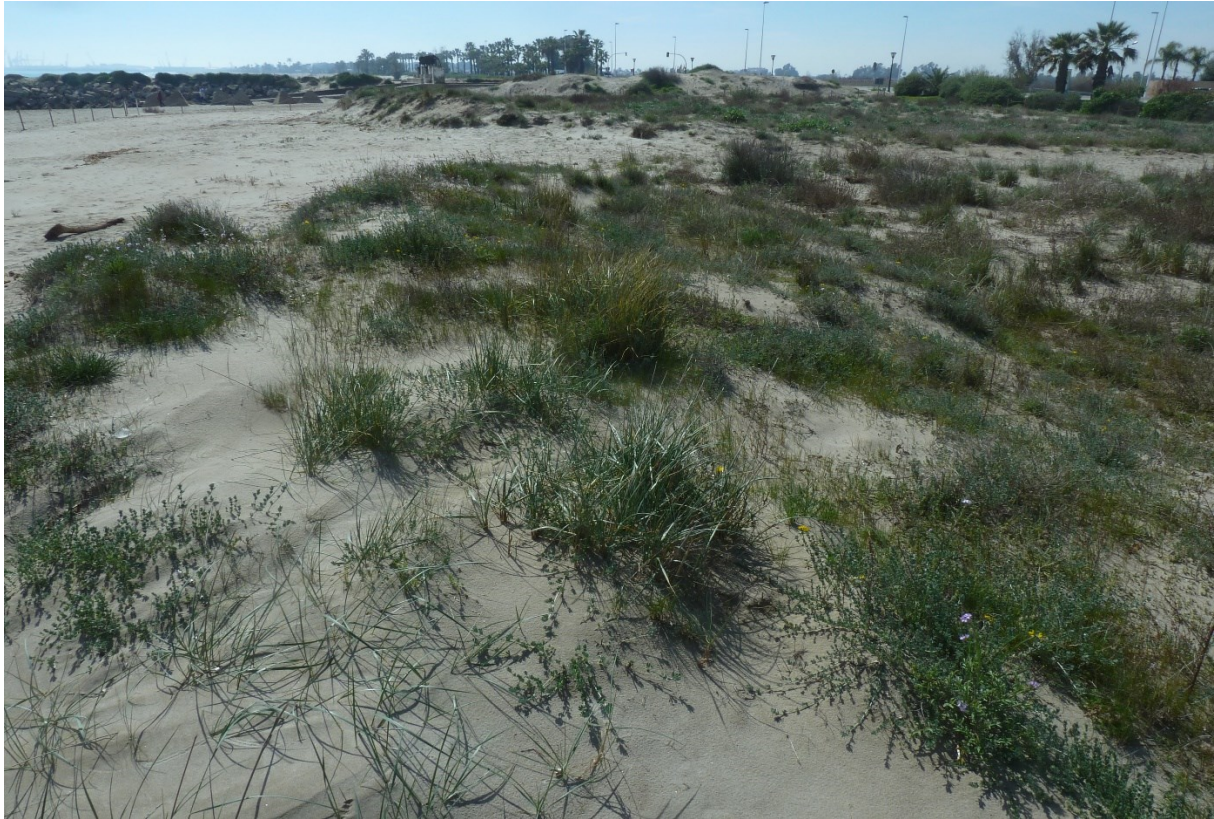
Hàbitats característics de dunes mòbils de la microreserva.

https://www.dogv.gva.es/datos/2019/08/21/pdf/2019_8188.pdf