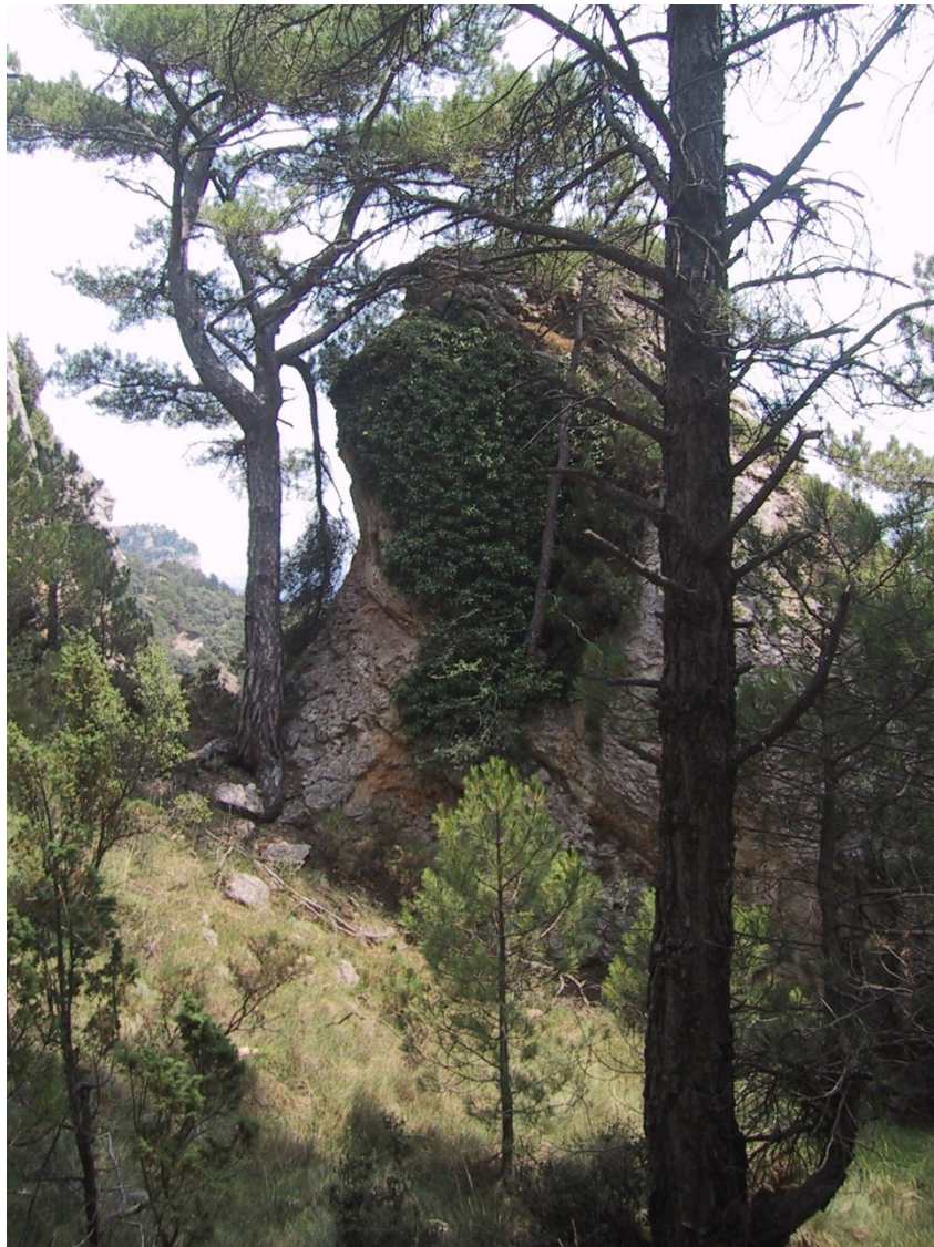
Dos de los hábitats característicos de la microrreserva: los pinares negrales y la vegetación rupícola con Salix tarraconensis .

http://www.docv.gva.es/datos/1998/12/02/pdf/1998_10292.pdf