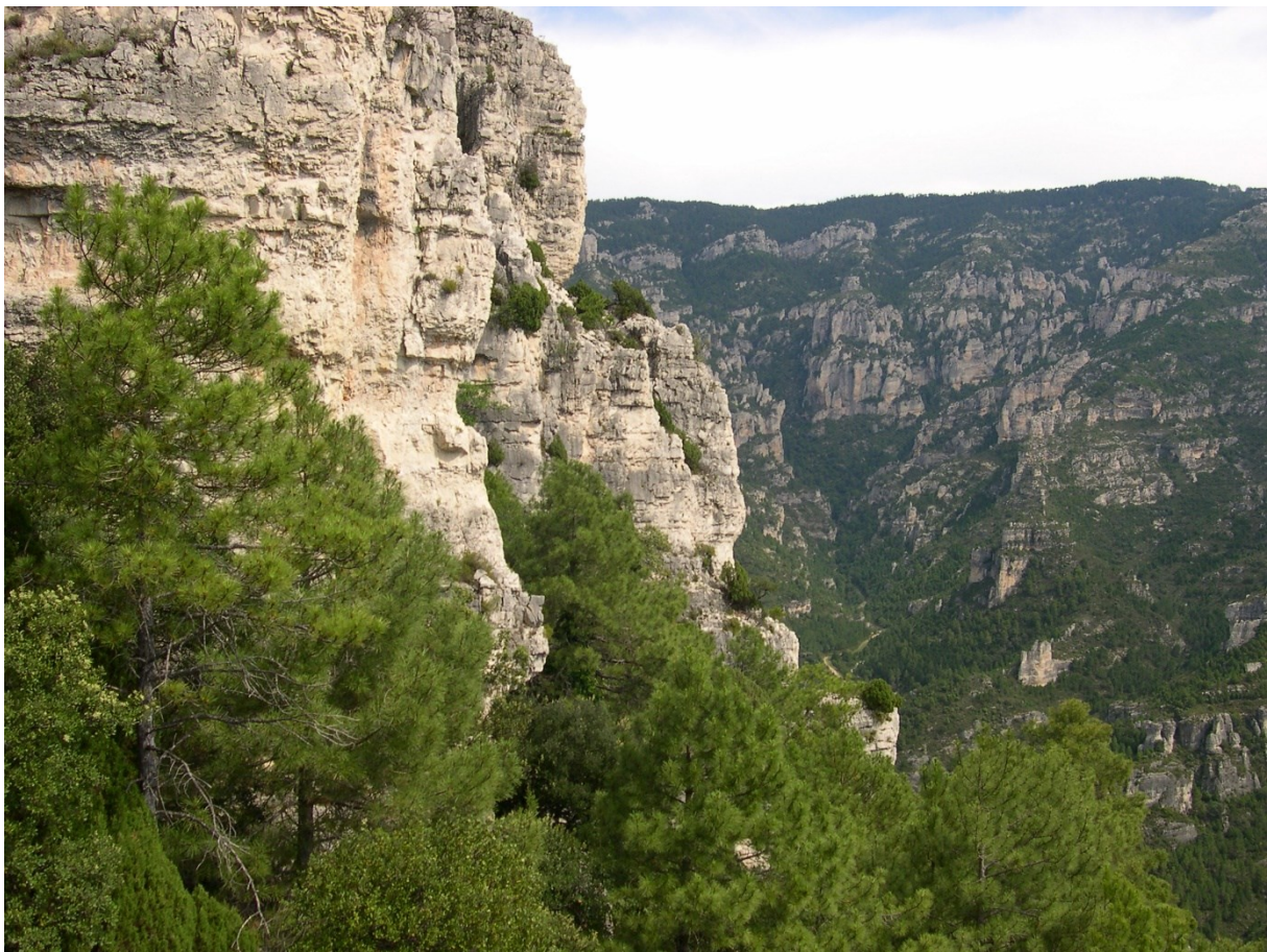
Panoràmica de la microrreserva on es desenvolupen comunitats rupícoles amb Anthirrhinum pertegasii .

http://www.docv.gva.es/datos/1998/12/02/pdf/1998_10292.pdf