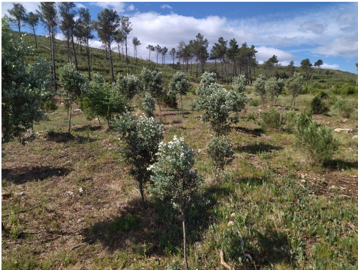
Trabajos de recuperación del hábitat prioritario de los pinares negrales (9530*) tras el incendio de 2012.

http://www.docv.gva.es/datos/2001/02/01/pdf/2001_673.pdf