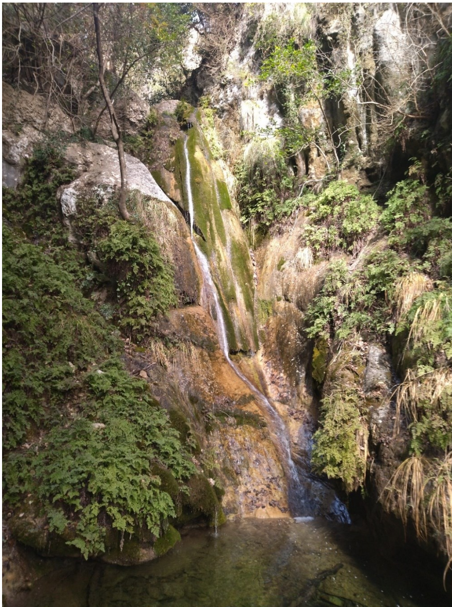
Uno de los hábitats característico de la microrreserva: las tobas calcáreas.

http://www.docv.gva.es/datos/2001/02/01/pdf/2001_673.pdf