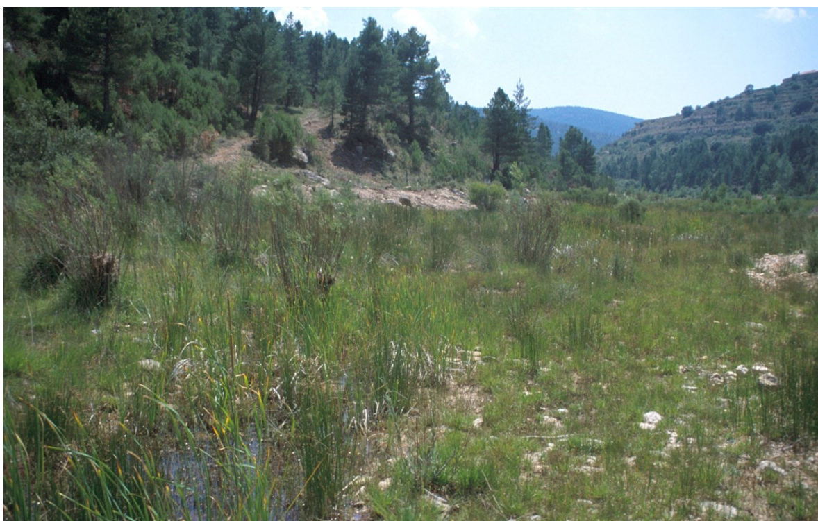
L'alternança de prats humits i secs, característics de la rambla de les Truites, són hàbitats òptims per acollir una varietat notable d'orquídiades.