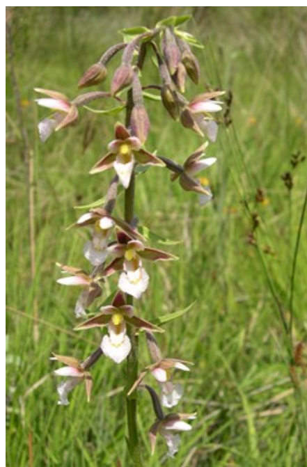
Apium repens (esquerra) colonitza herbassars humits i poc alterats. Epipactis palustris (dreta) és una orquídia que viu en sòls permanentment entollats.