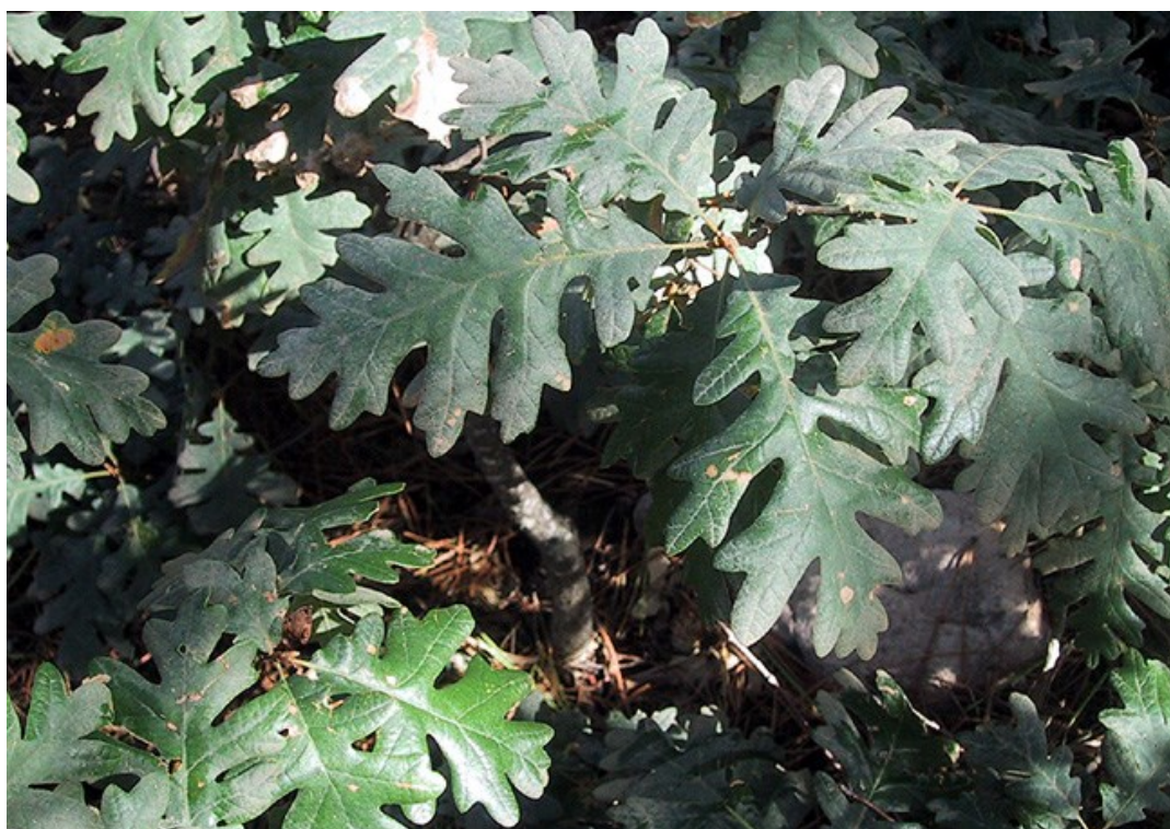
El roble melojo ( Quercus pyrenaica ) es una especie escasa en la Comunitat Valenciana debido a sus requerimientos ecológicos de suelos ácidos y ambientes frescos.

Hieracium amplexicaule (R) Hieracium lychnitis (R) Jasione sessiliflora subsp. appressifolia (E, R) Juniperus communis subsp. communis (R) Leucanthemopsis pallida subsp. virescens (E, R) Linaria repens subsp. blanca (E) Luzula forsteri (R) Notholaena marantae (P, R) Pinus sylvestris (R) Polypodium vulgare (R) Quercus pyrenaica (P, R) Scrophularia tanacetifolia (E) Silene nutans (R) Sorbus torminalis (P, R)