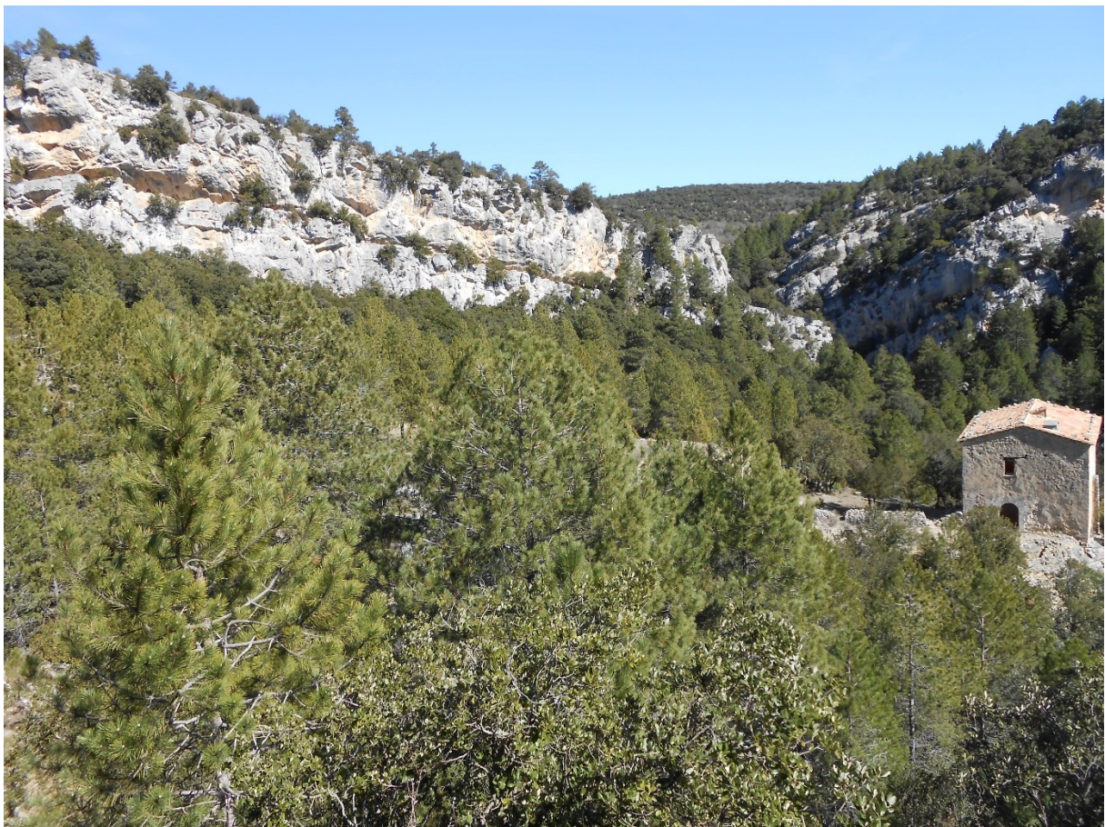
Vista dels penya-segats rocosos de la microreserva en el quals es desenvolupa la vegetació casmofítica.

https://www.dogv.gva.es/datos/2019/08/21/pdf/2019_8188.pdf