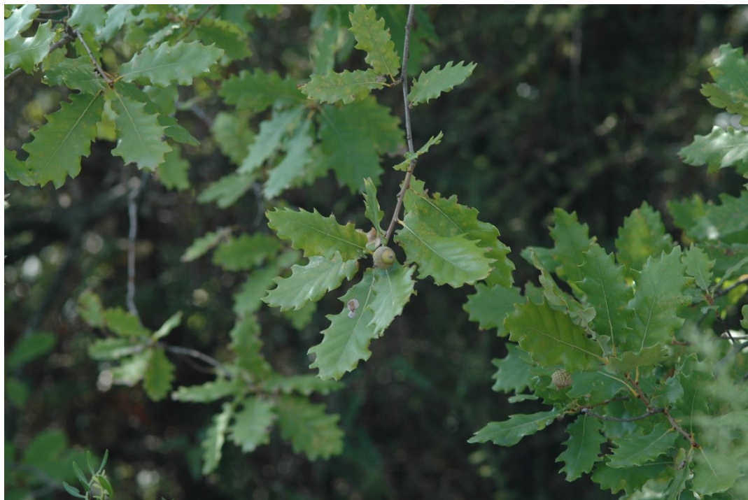
Quercus x couthinói és un híbrid entre Quercus faginea i Quercus robur .