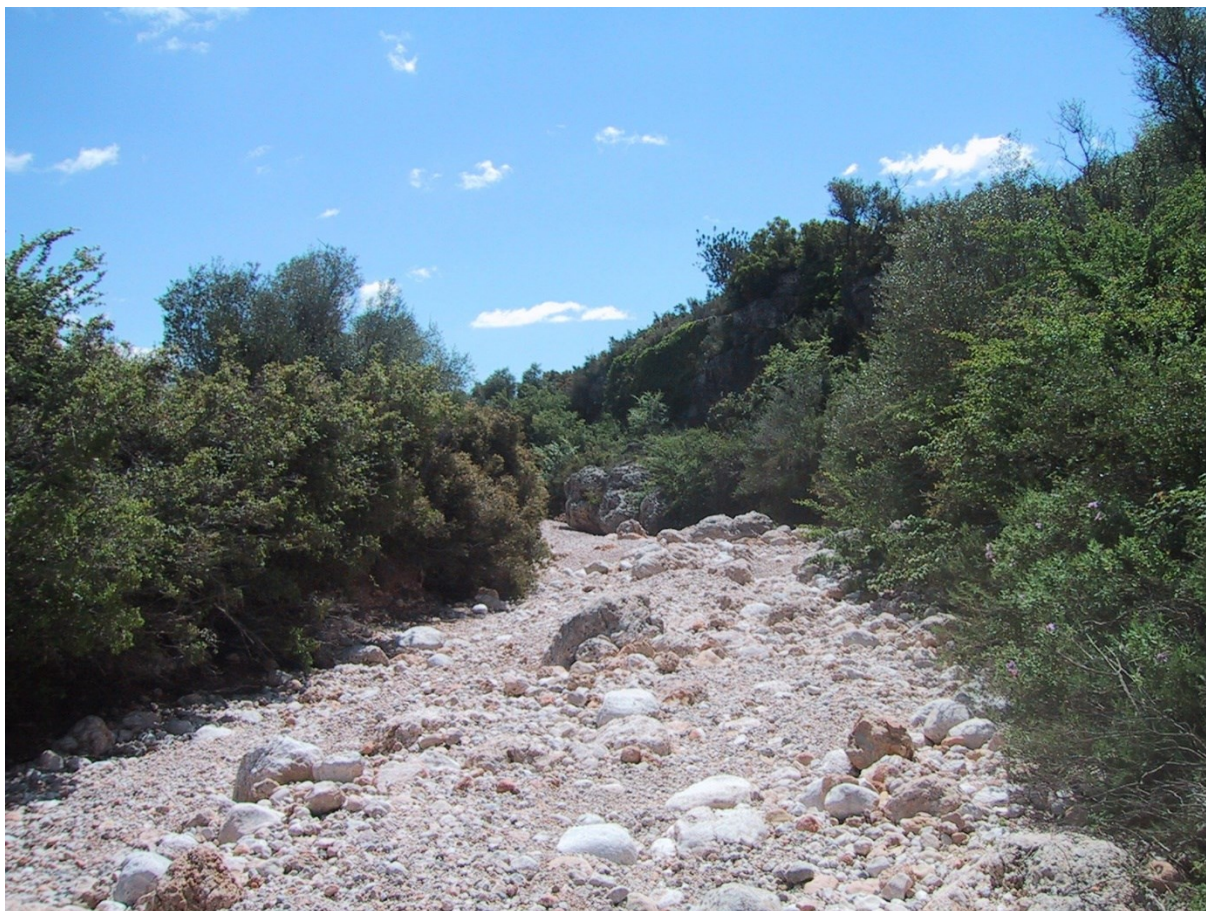
Panoràmica del barranc dels Rodejos, on es troba la microreserva i el Toll Negre.