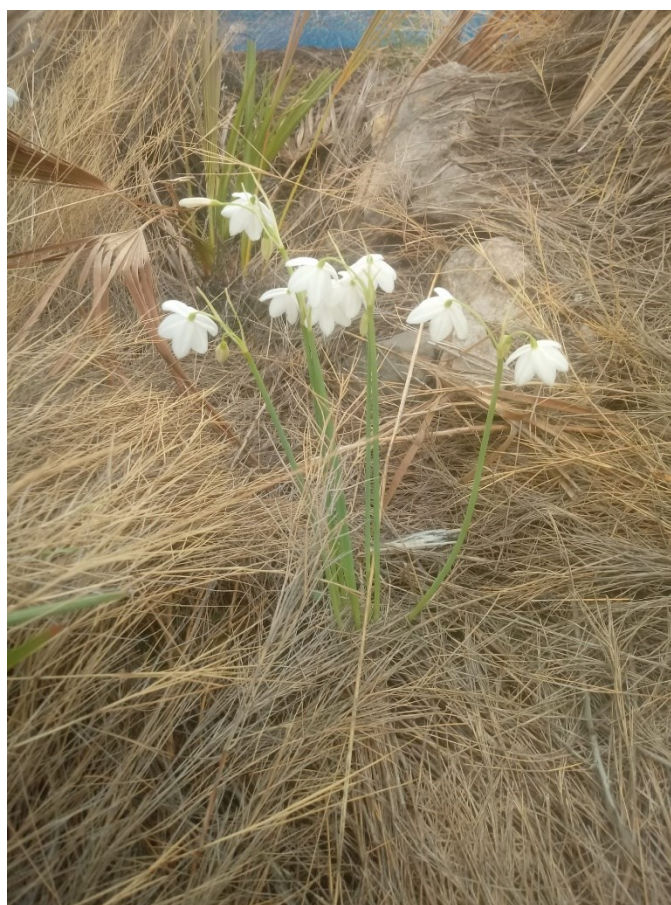
Acis valentina es un endemismo valenciano de las montañas calcáreas litorales.