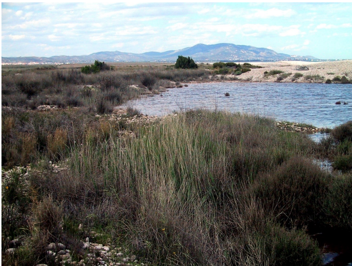
Vista general de la microrreserva en la que se observa el cordón dunar de cantos rodados y la laguna temporal.