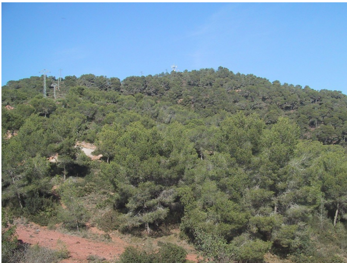
Vista general del pinar de pino carrasco ( Pinus halepensis ) que caracteriza la vegetación arbórea de la microrreserva.