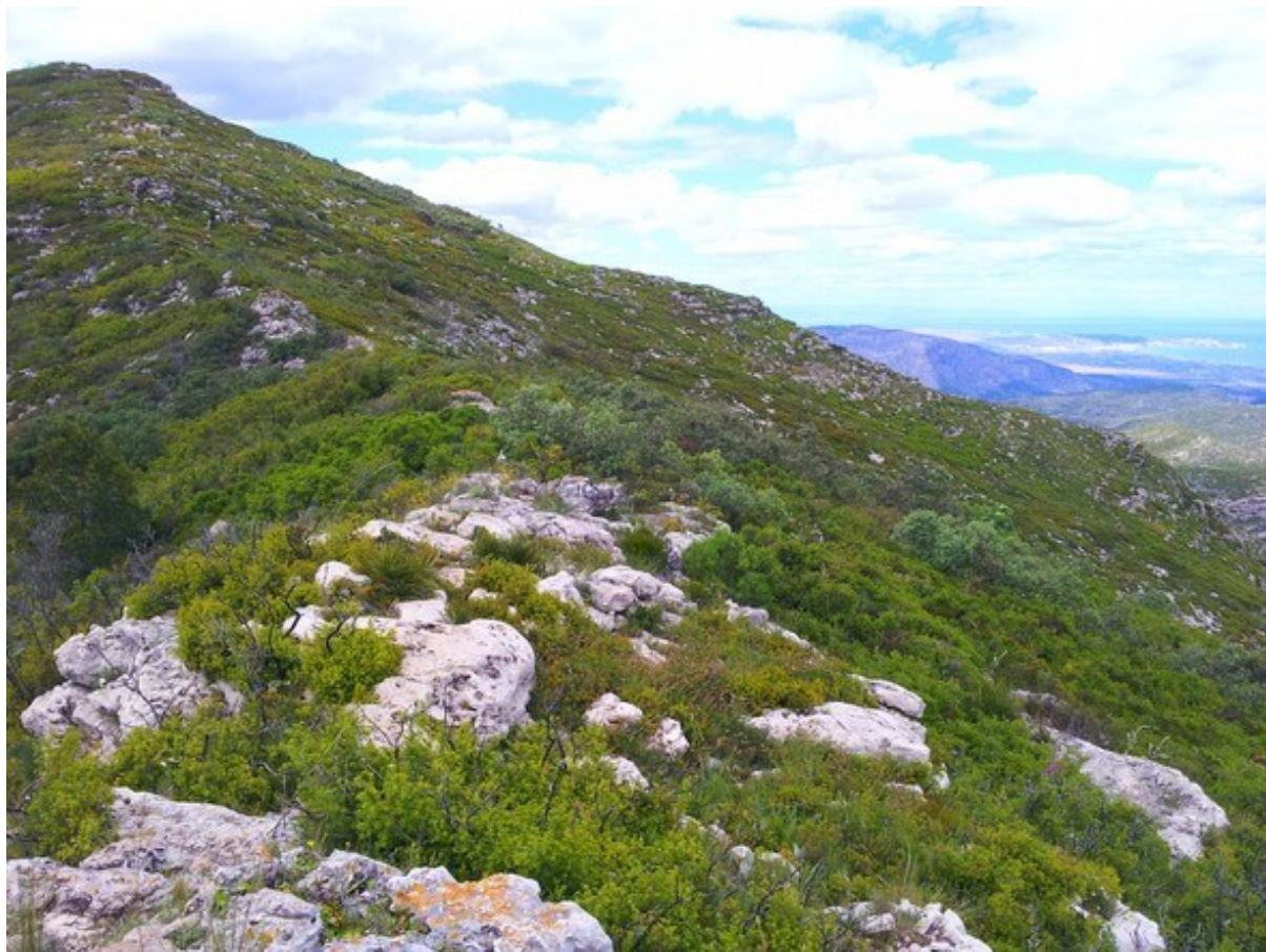
Vista de la part alta de la microreserva en la qual s'observa la vegetació arbustiva dominant corresponent a la brolla calcícola.

http://www.docv.gva.es/datos/1999/05/28/pdf/1999_4785.pdf