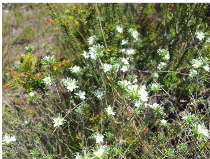
Arenaria aggregata subsp. pseudoarmeriastrum és un endemisme diànic present a la microreserva.