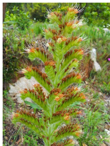
Inflorescència d' Echium flavum subsp. saetabense , endemisme del sector Setabenc que es troba protegit en la categoria d'espècies Protegides No Catalogades .