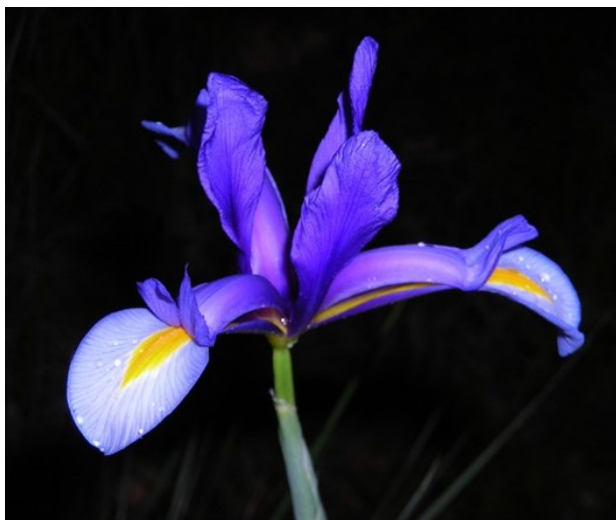
Xiphion vulgare és també una espècie rara que té una floració especialment cridanera.