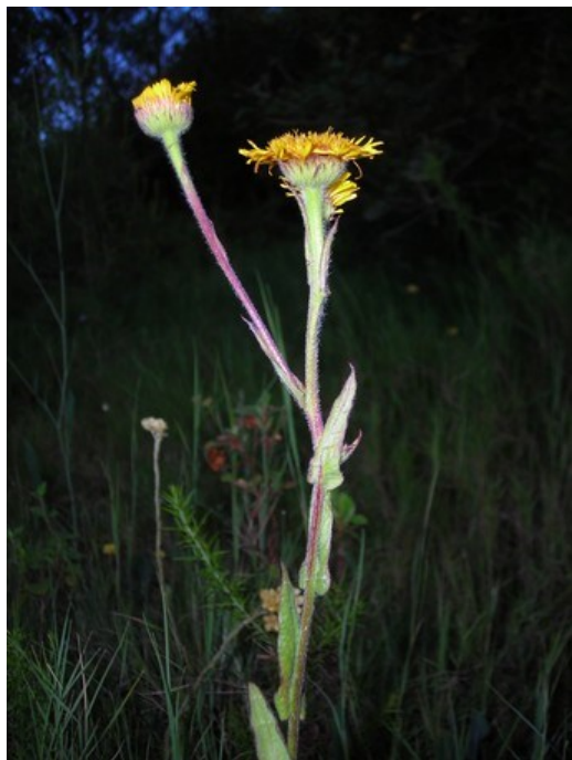
Pulicaria odora és una espècie rara en la flora valenciana que està present a la microreserva.

Leucanthemum gracilicaule (E) Orchis anthropophora (P, R) Paronychia suffruticosa (E) Phlomis crinita (E) Phlomis purpurea (E) Pulicaria odora (R) Quercus suber (R) Rhamnus lycioides (E) Scrophularia tanacetifolia (E) Selaginella denticulata (R) Stachys heraclea (R) Stachys officinalis (R) Teucrium ronnigeri subsp. ronnigeri (E) Thymus vulgaris subsp. aestivus (E) Trisetum velutinum (E, R) Xiphion vulgare (R)