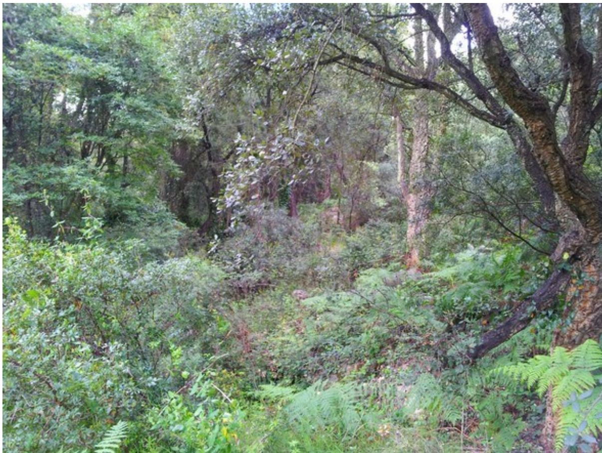
Aspecte de l'hàbitat 9330 en el qual s'observen exemplars de surera ( Quercus suber ) i carrasca ( Quercus ilex subsp. rotundifolia ).

http://www.docv.gva.es/datos/2002/12/02/pdf/2002_13174.pdf