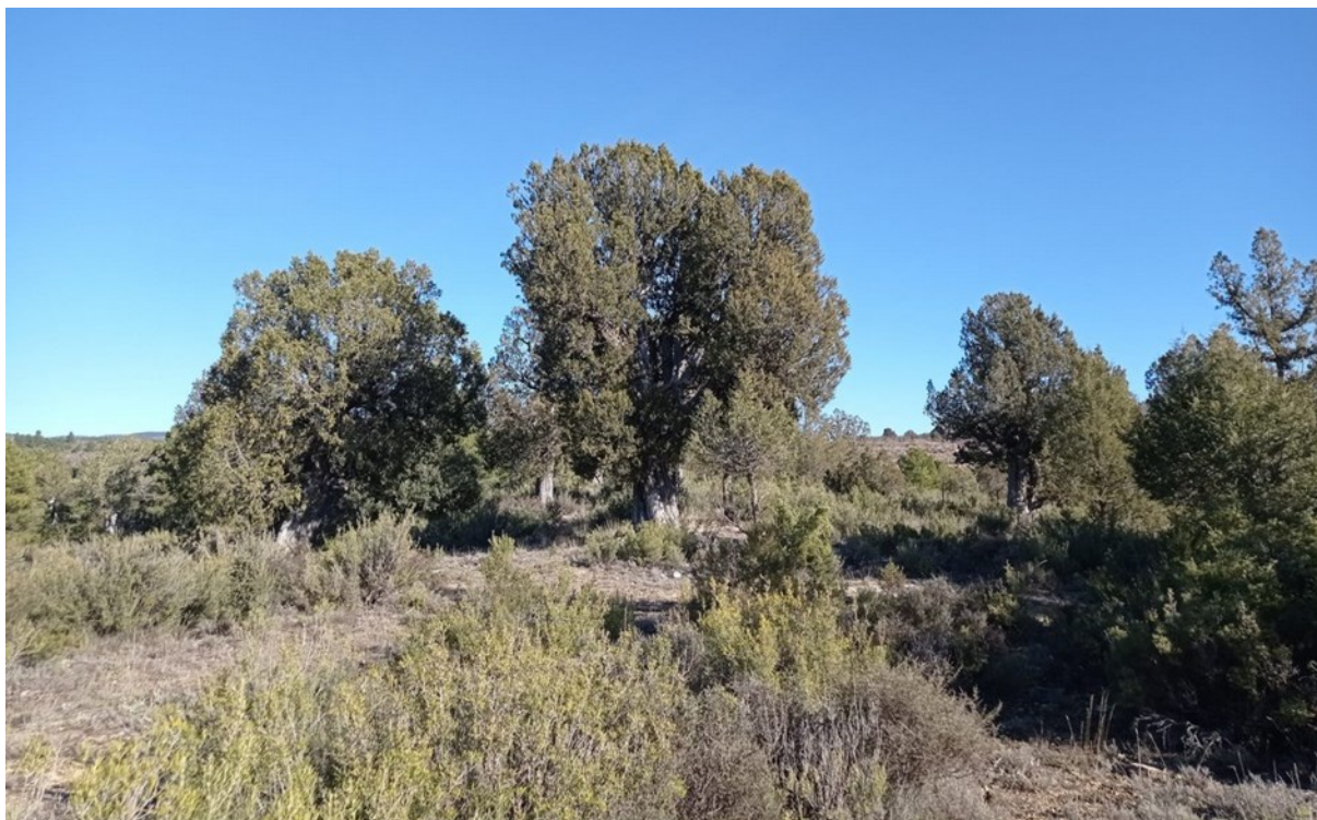
Imatge de la microreserva en la qual es pot observar l'aspecte del savinar corresponent a l'hàbitat 9560, amb exemplars de savina turífera ( Juniperus thurifera ) dispersos.