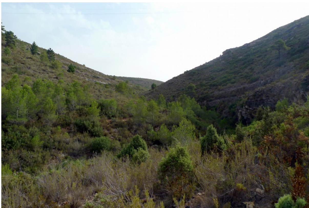
Vista general de la microreserva en la qual s'observa el predomini de la vegetació de brolla calcícola corresponent a l'hàbitat 5330.