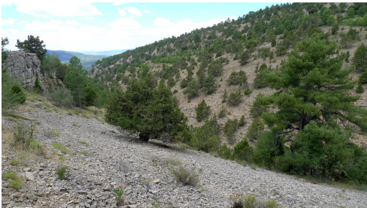
Imagen de un tramo del barranco en el que se observa en primer plano una de las vertientes pedregosas con ejemplares dispersos de sabinas y pinos.