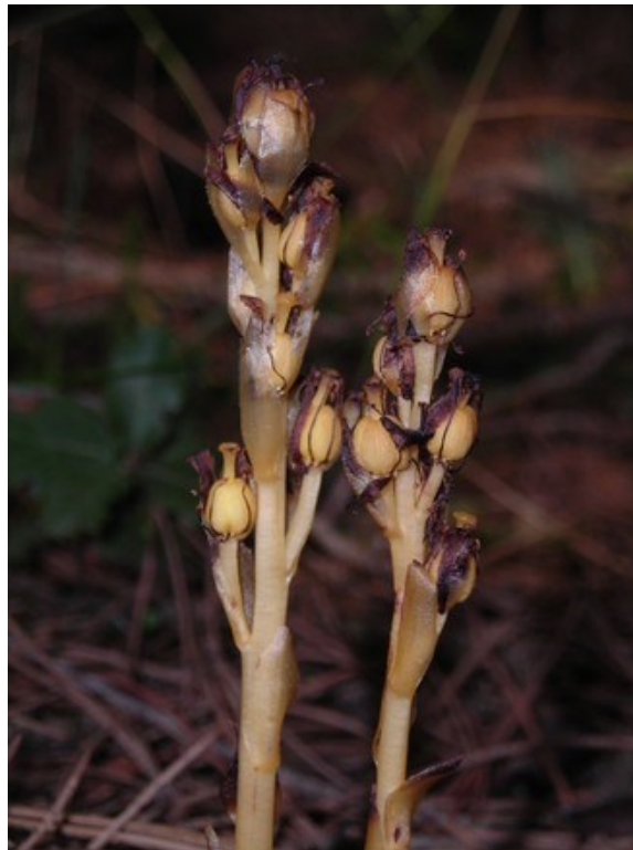
Ribes uva-crispa (izquierda) y Monotropa hypopitys (derecha) son dos de las especies protegidas que se pueden observar en la microrreserva.