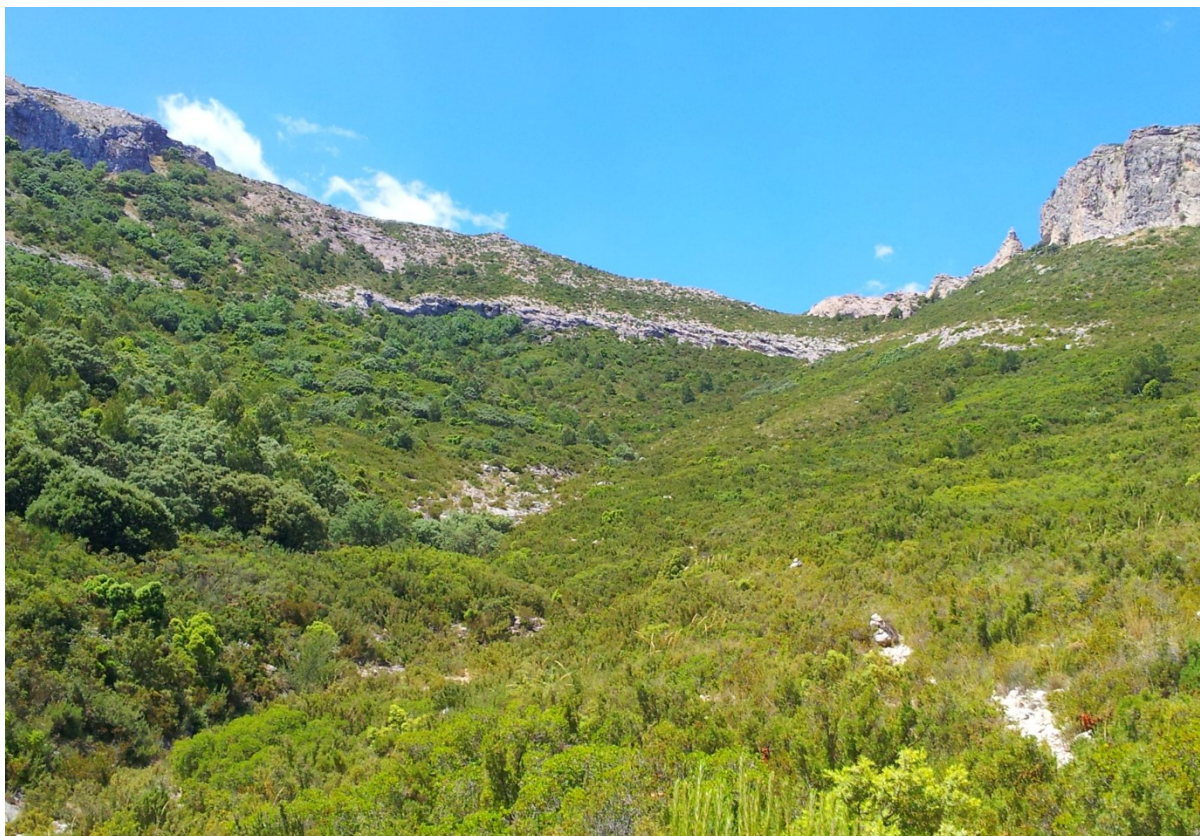
Vista de la part alta de la microreserva on hi ha una font i les formacions d'aurons ( Acer opalus subsp. granatense ) i freixes de flor ( Fraxinus ornus ). També s'observa al fons l'hàbitat rupícola.