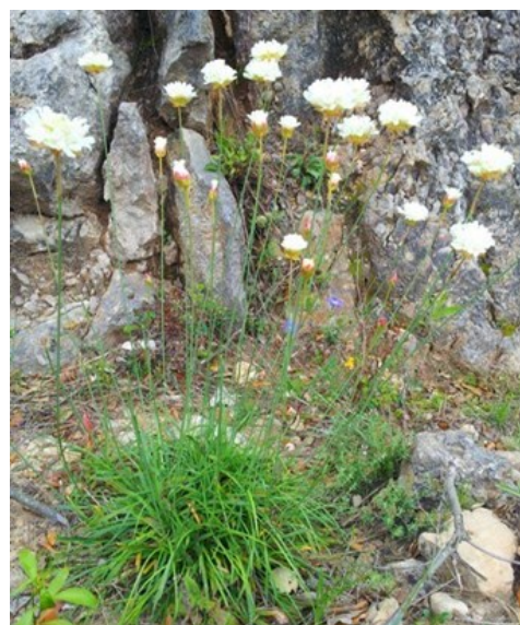
Teucrium pugionifolium (esquerra) és una de les espècies més interessants de la microreserva. Armeria alliacea subsp. alliacea (dreta) és un dels endemismes presents a la microreserva.