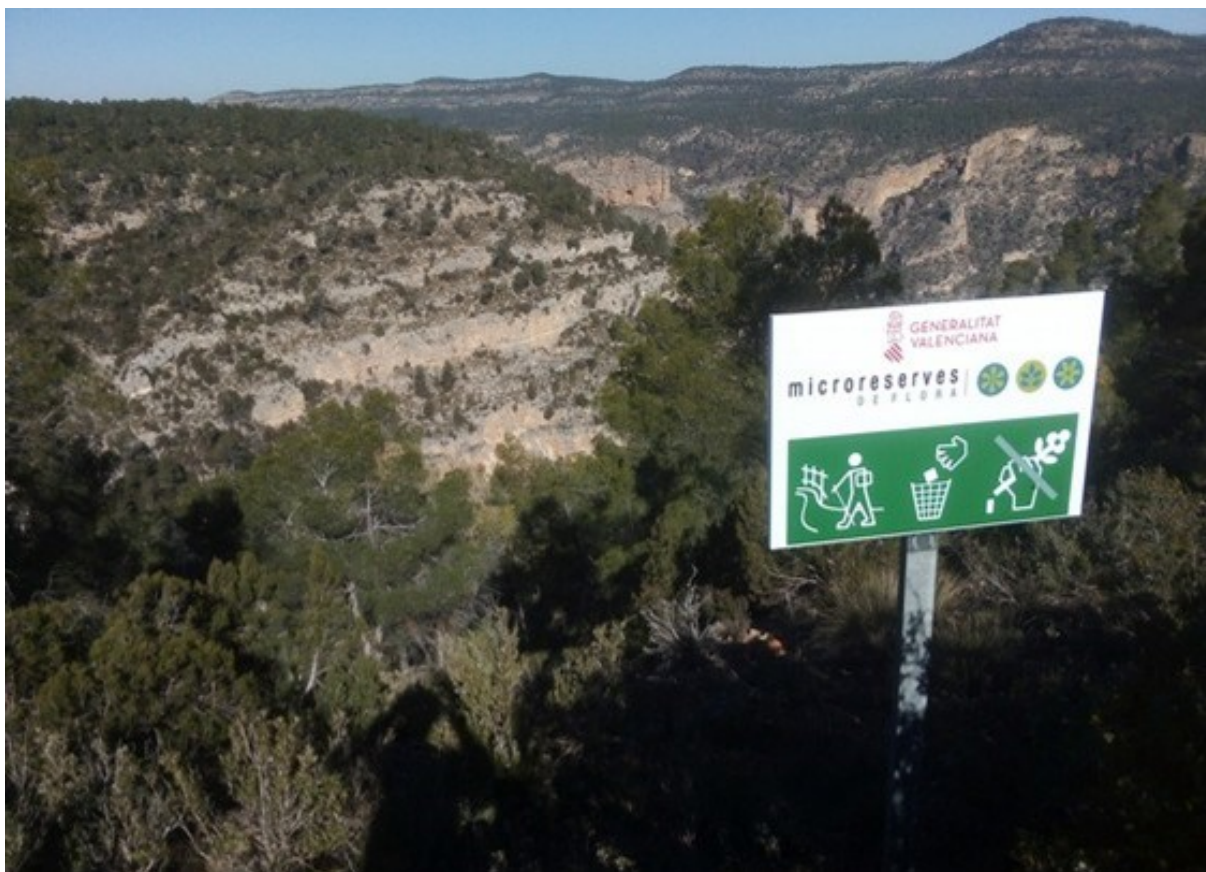
Vista general del barranc amb el cartell de microreserves en el primer pla.