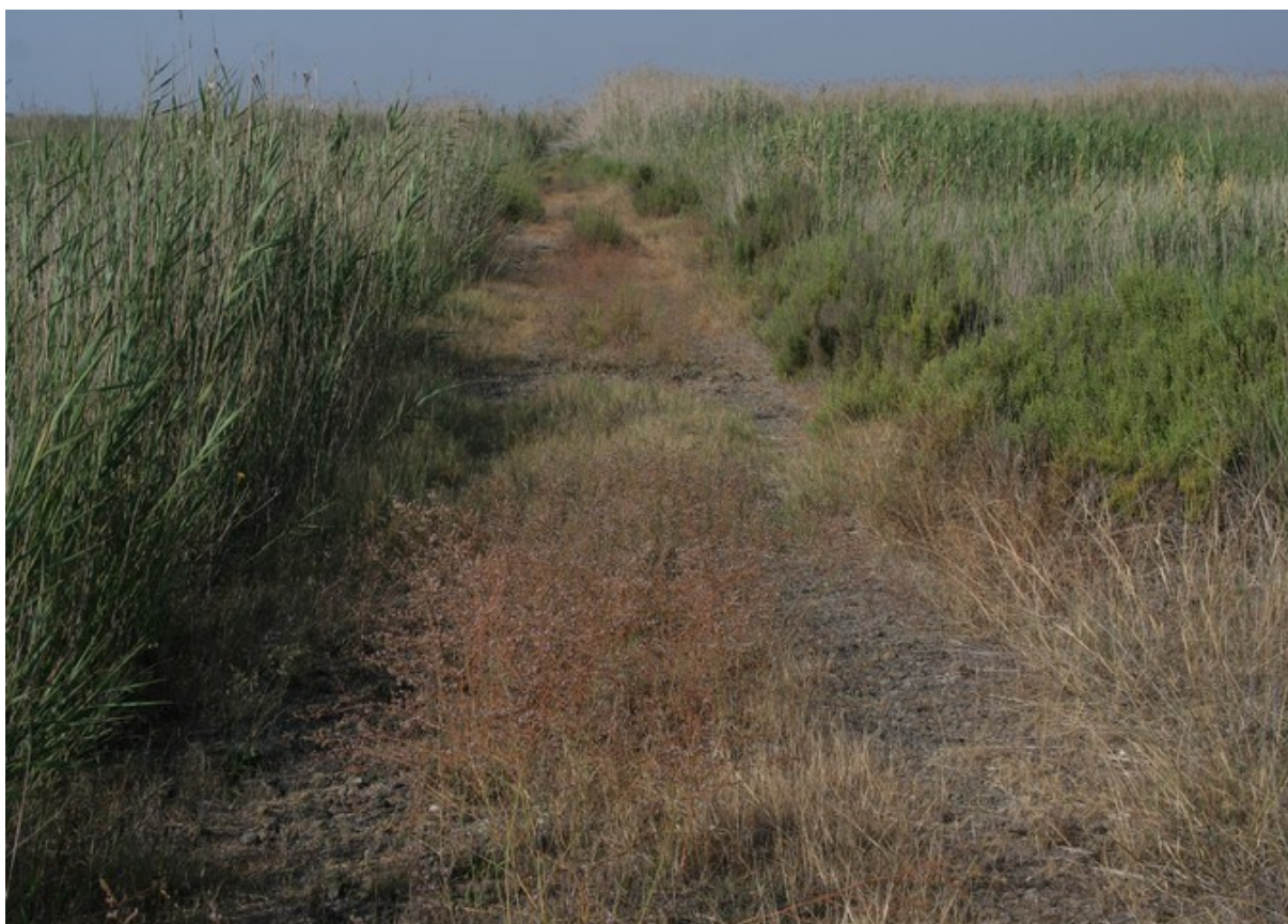
Aspecte del camí, una mica més elevat que la resta de la microreserva, on creix la població de l'ensopeguera de de Dufour ( Limonium dufourii ).