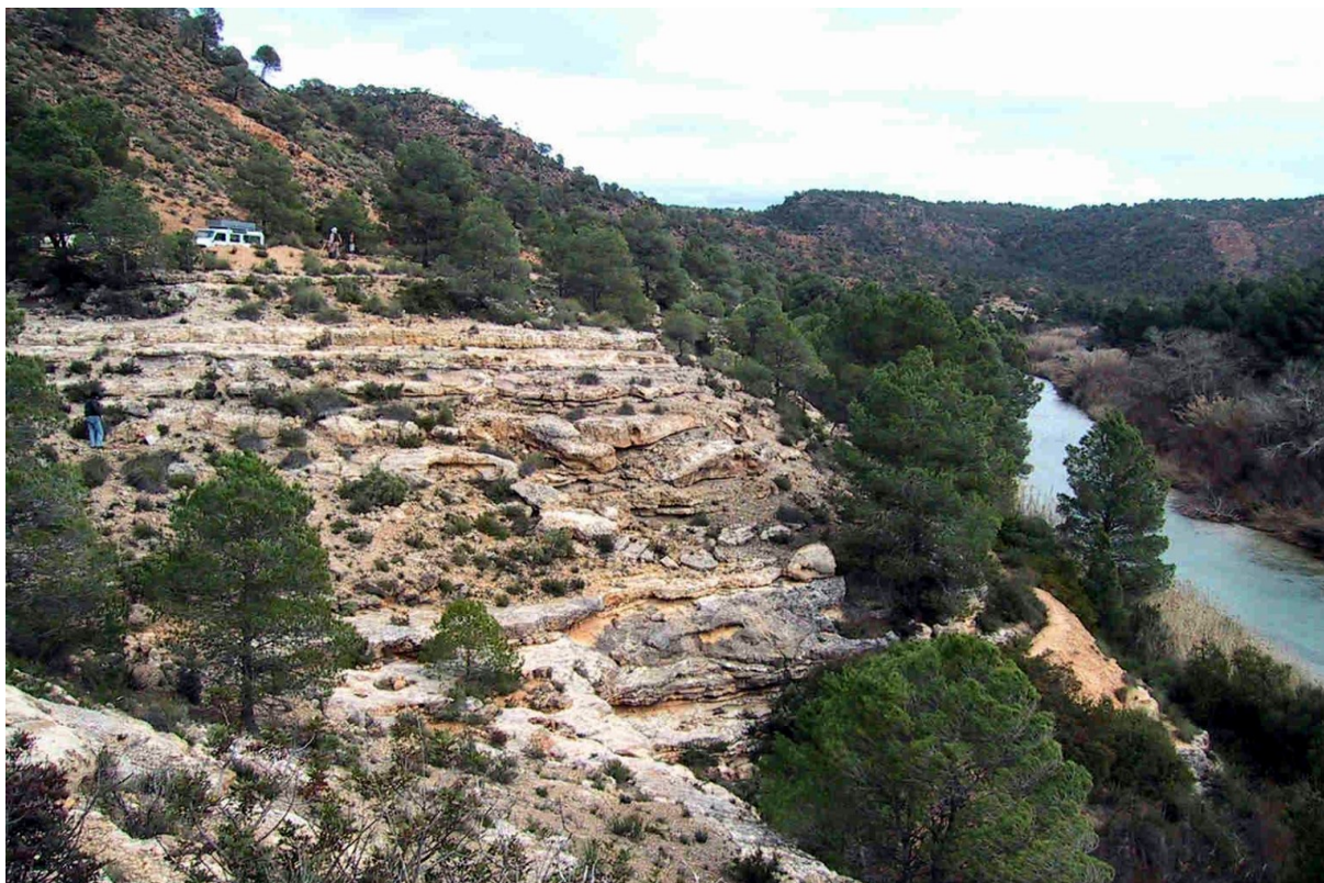
Vista de la microreserva en la part de la caiguda al riu Cabriol. S'observa la formació de brolla aclarida amb pins blancs ( Pinus halepensis ) dispersos.