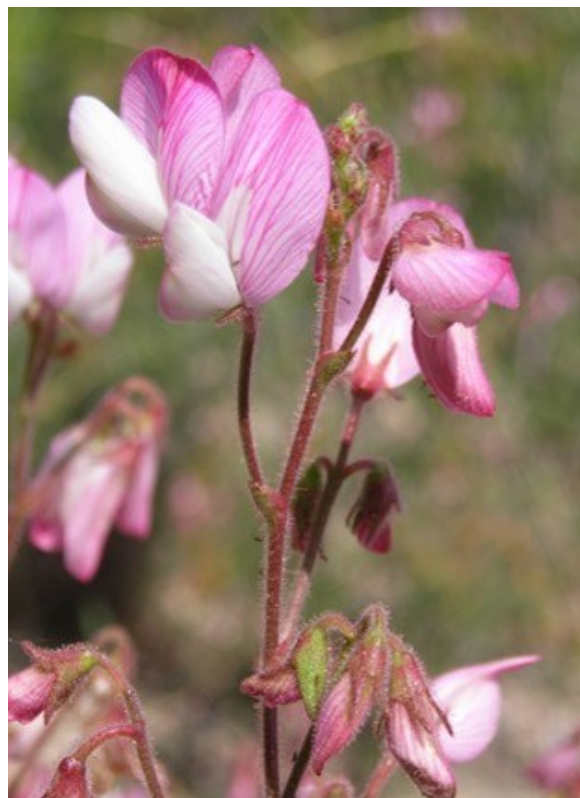
Limonium cofrentanum (esquerra) i detall de la inflorescència d' Ononis fruticosa (dreta), dos dels endemismes que creixen a la microreserva.

Tipus d'hàbitats (Codi Natura 2000) (Hàbitats prioritaris*)