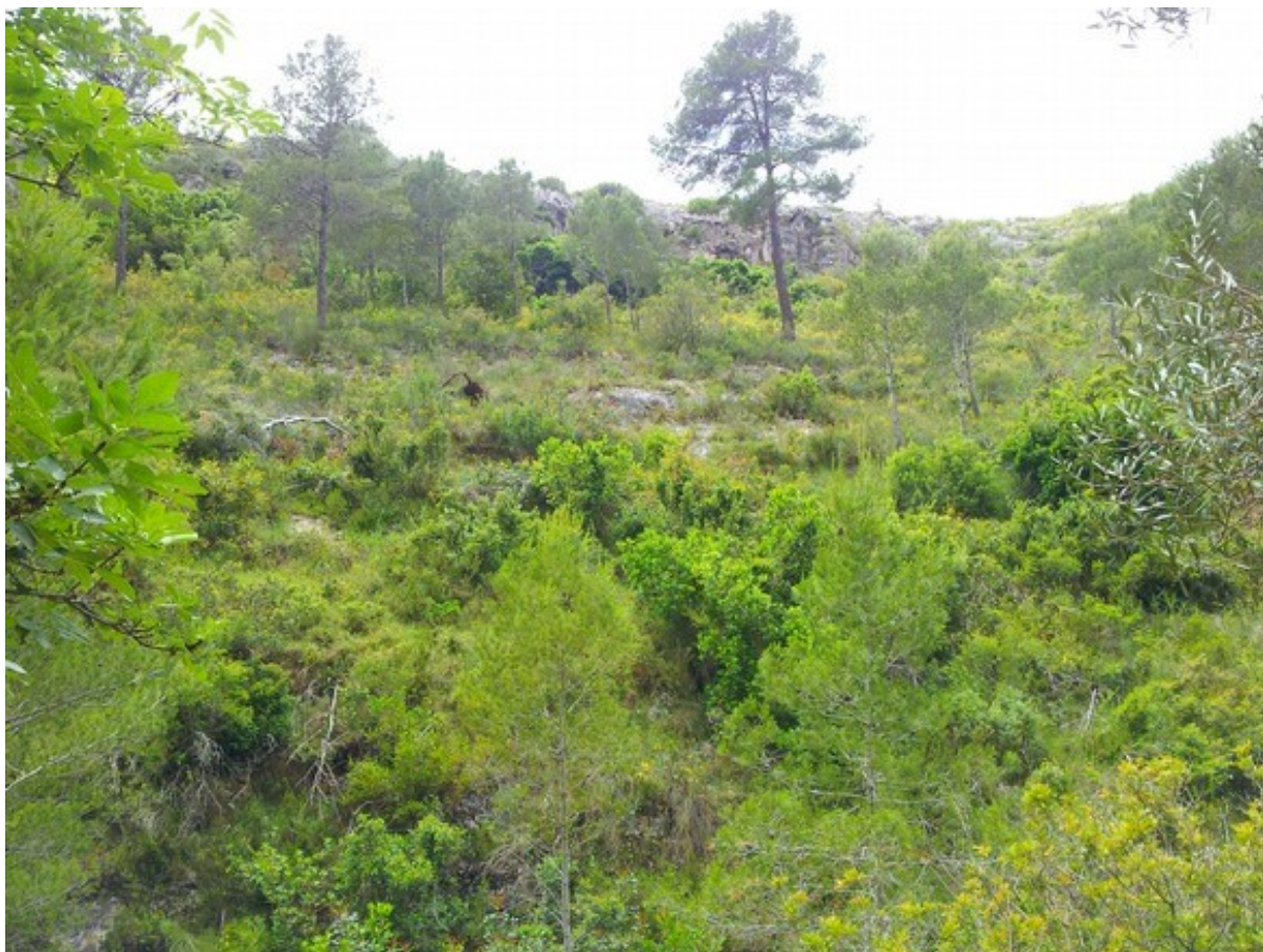
Vista de la microrreserva en la que se observa el hábitat 5330 en el primer plano y el hábitat 8210 al fondo.