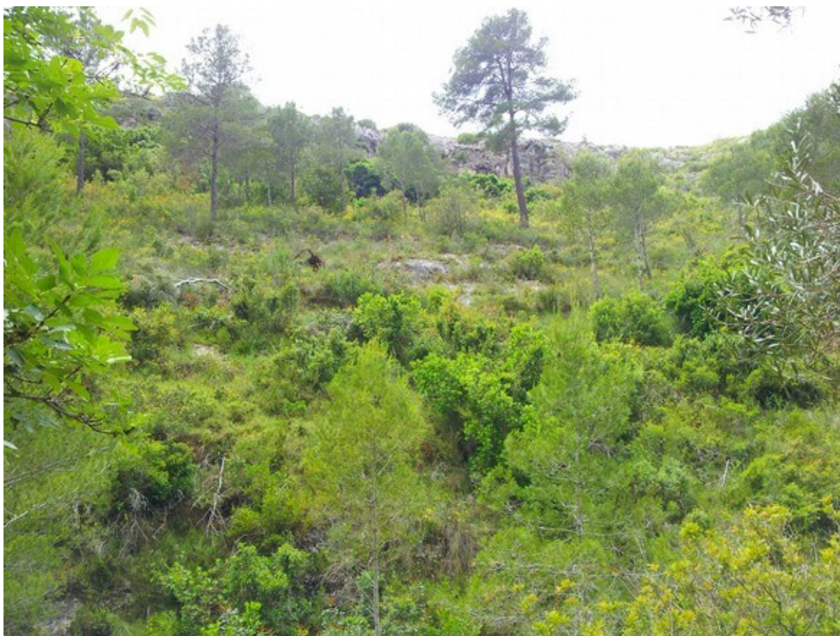
Vista de la microreserva en la qual s'observa l'hàbitat 5330 en el primer pla i l'hàbitat 8210 al fons.