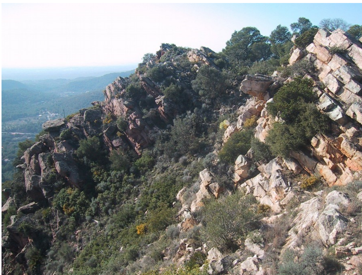
Vista de la microrreserva en la que se observa perfectamente el hábitat correspondiente a las pendientes rocosas silíceas 8220.